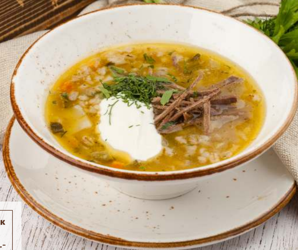
Рассольник с говядиной [250/20g] 120.-