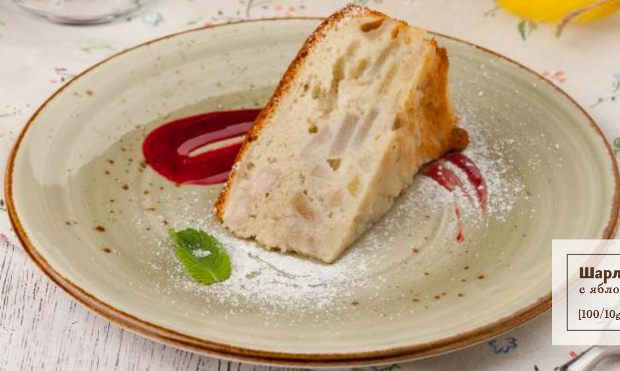
Шарлотка с яблоками [100/10g] 90.-