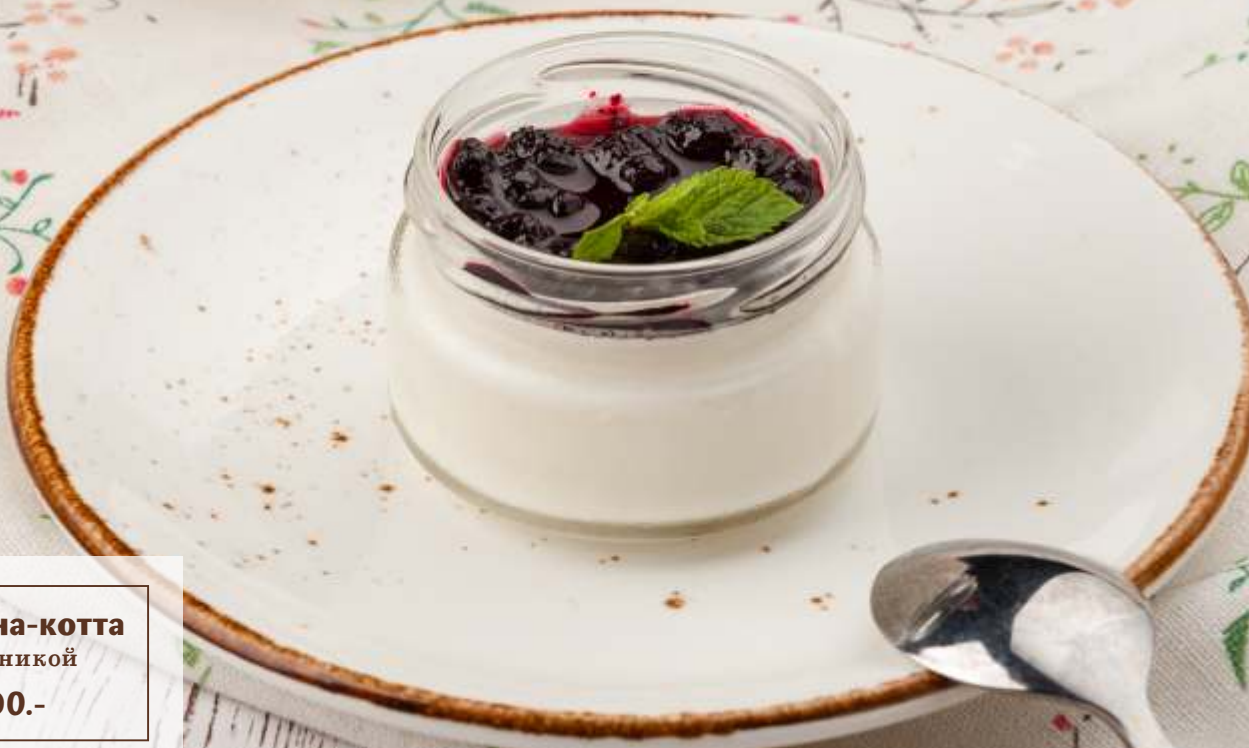
Панна-котта с черникой [60g] 90.-