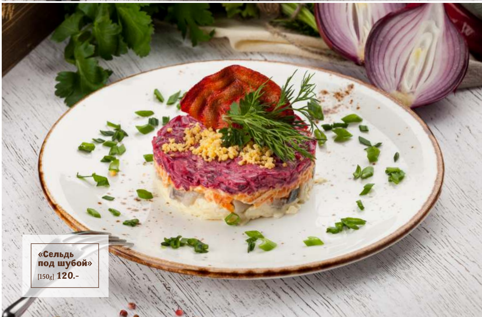
«Сельдь под шубой» [150g] 120.-