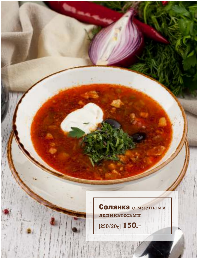
Солянка с мясными деликатесами [250/20g] 150.-