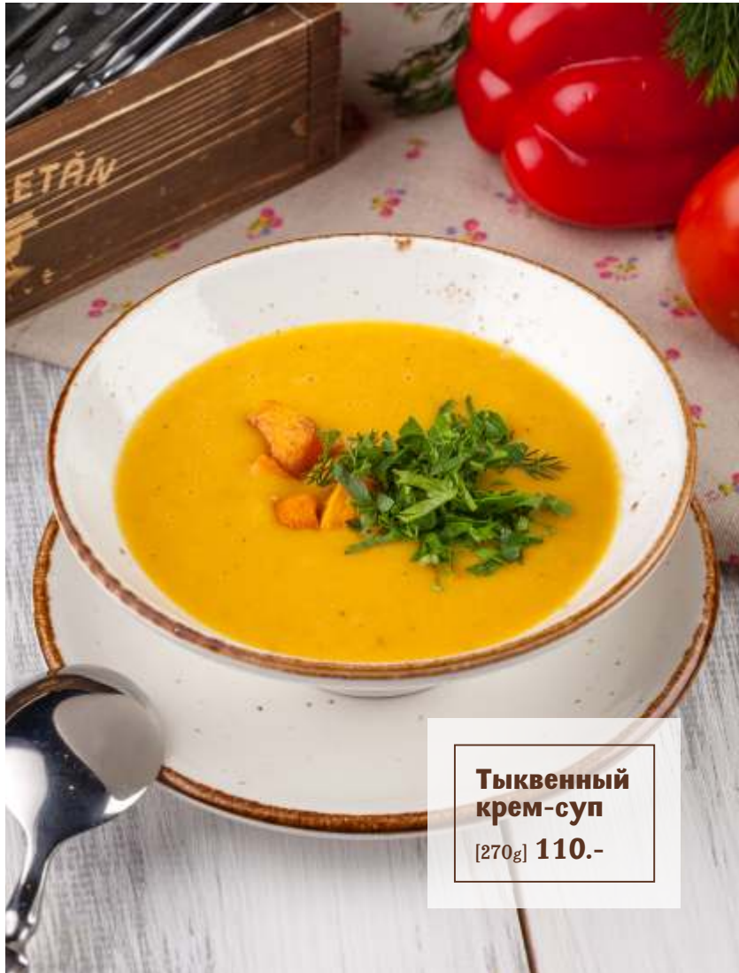
Тыквенный крем-суп [270g] 110.-