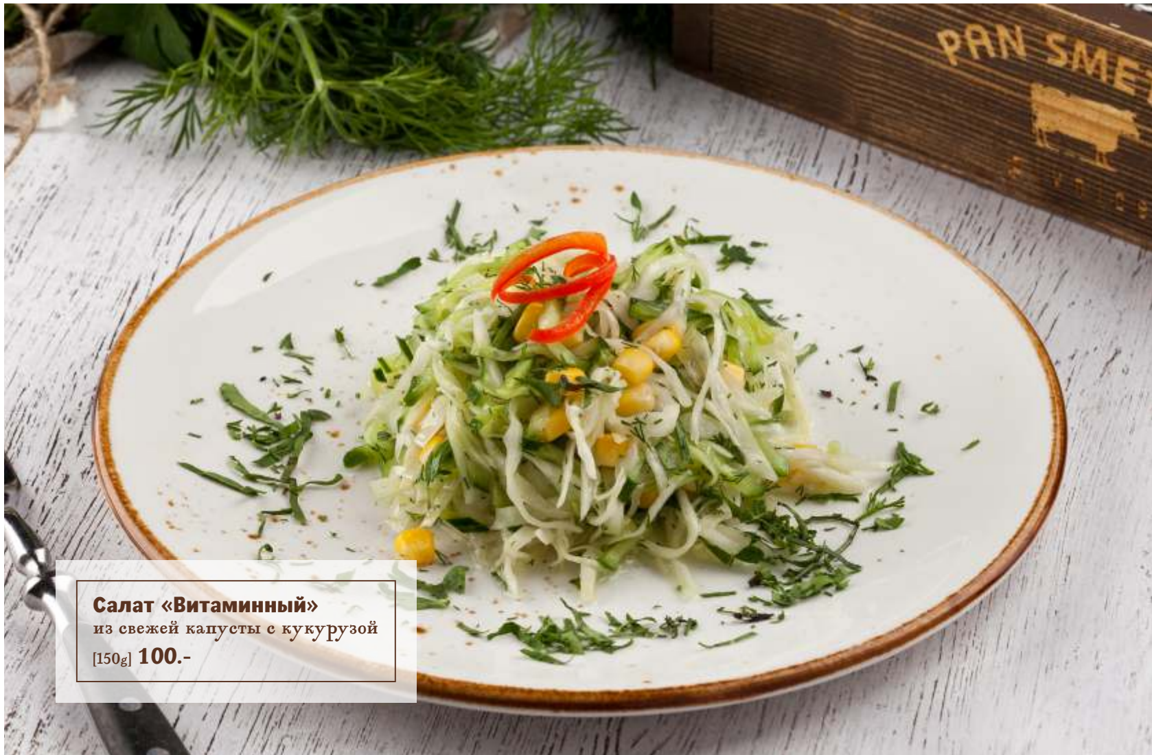
Салат «Витаминный» из свежей капусты с кукурузой [150g] 100.-