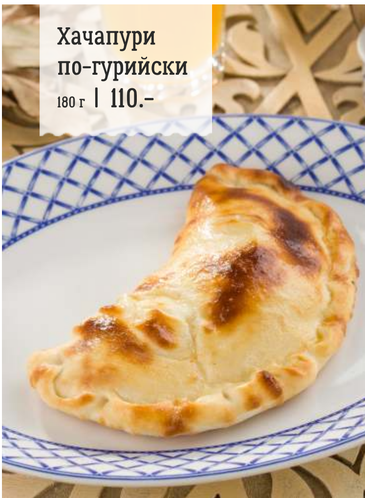
Хачапури по-гурийски 180 г | 110.-