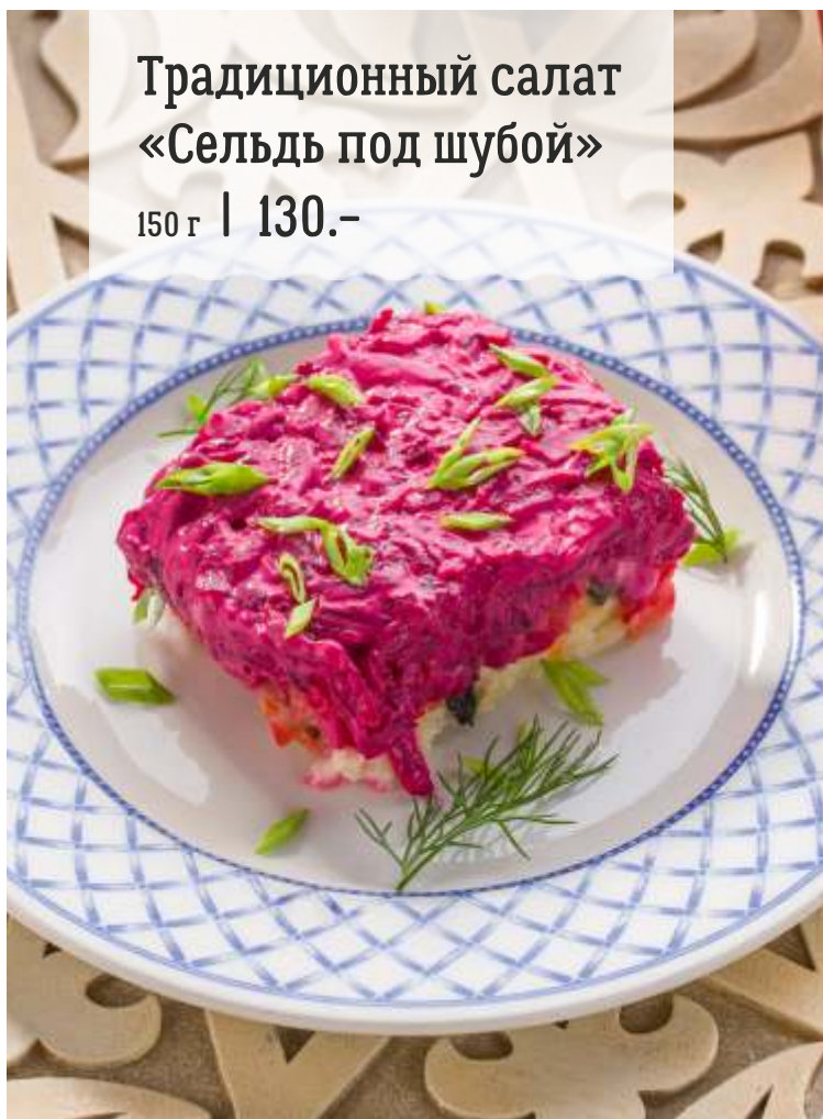
Традиционный салат «Сельдь под шубой» 150 г | 130.-