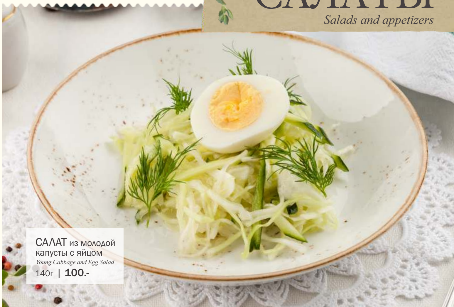
САЛАТ из молодой капусты с яйцом Young Cabbage and Egg Salad 140г | 100.-