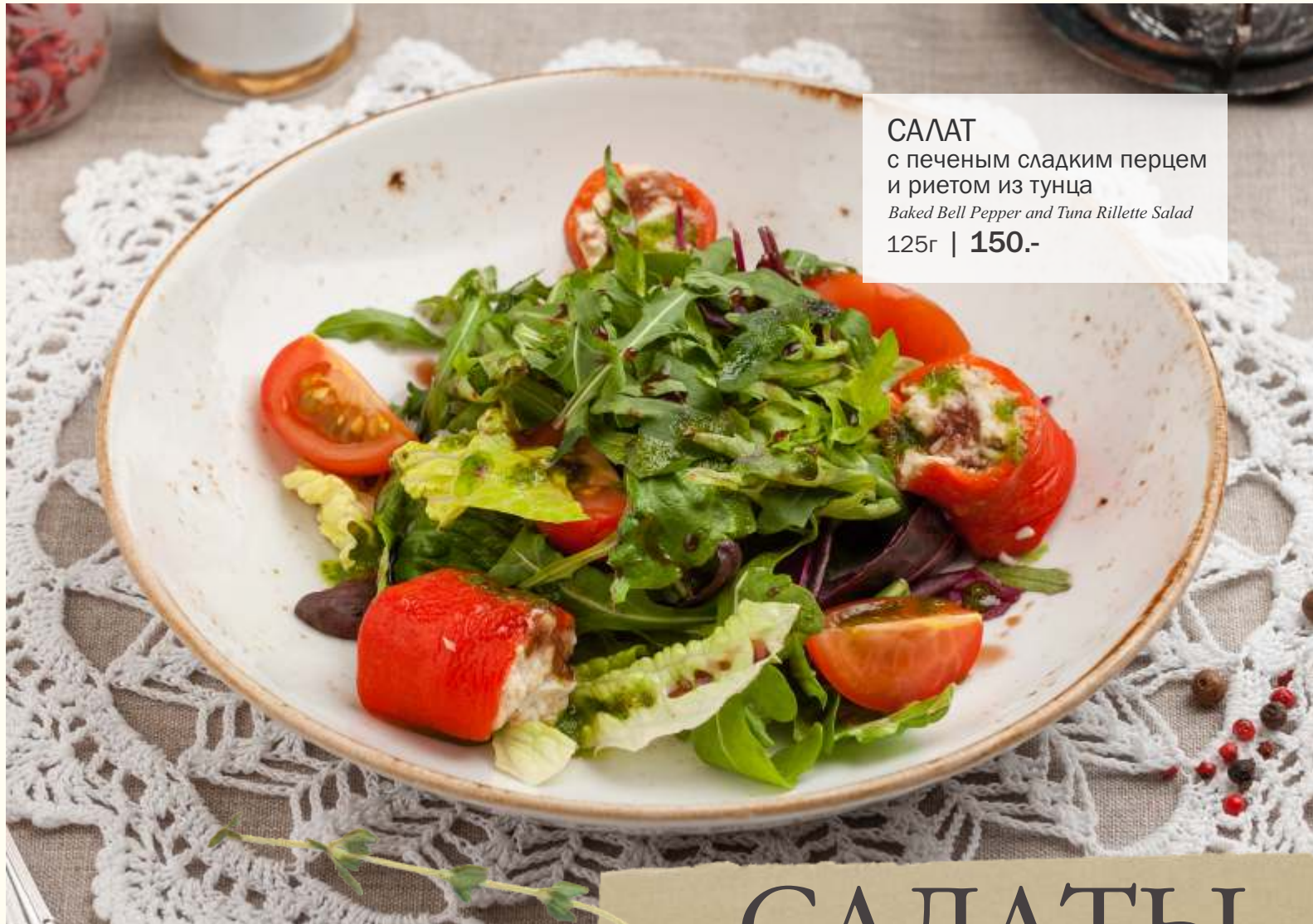
САЛАТ с печеным сладким перцем и рьетом из тунца Baked Bell Pepper and Tuna Rilette Salad 125г | 150.-