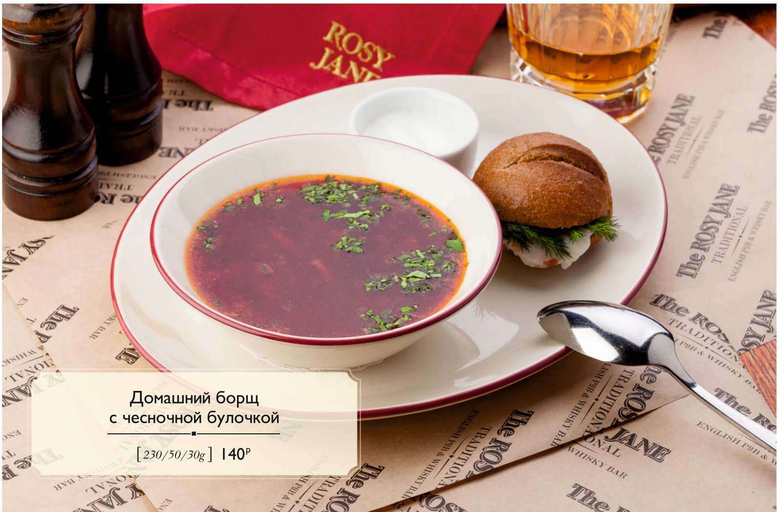
Домашний борщ с чесночной булочкой