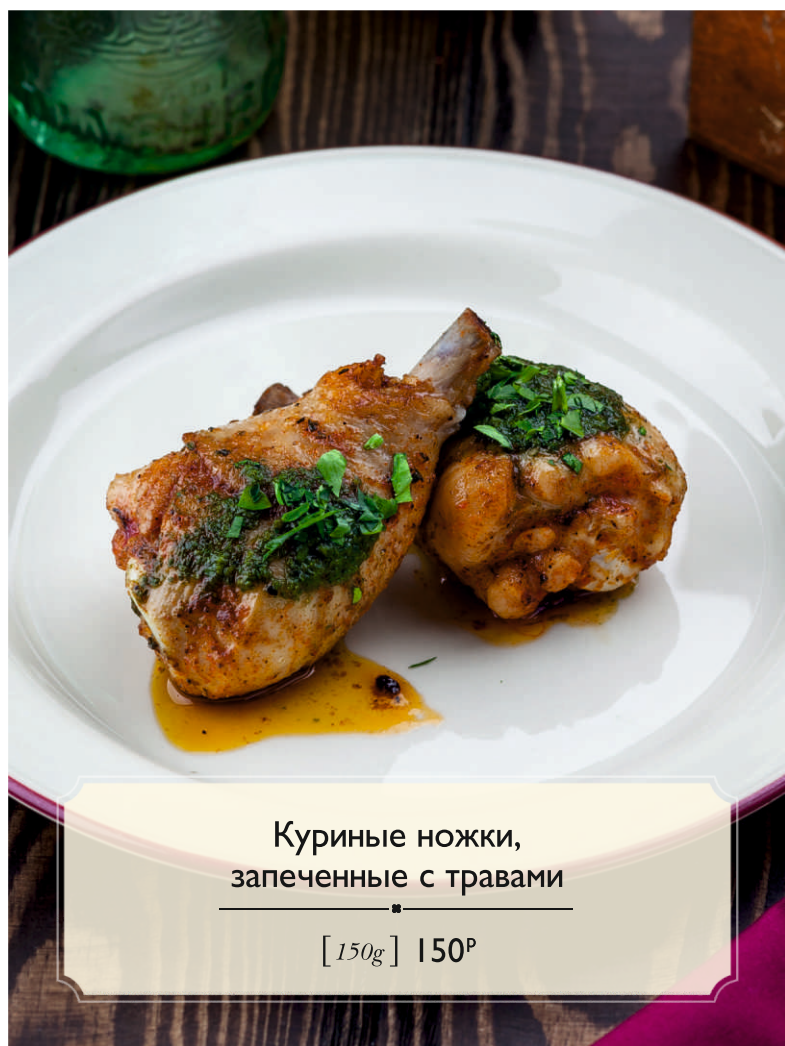
Куриные ножки, запеченные с травами