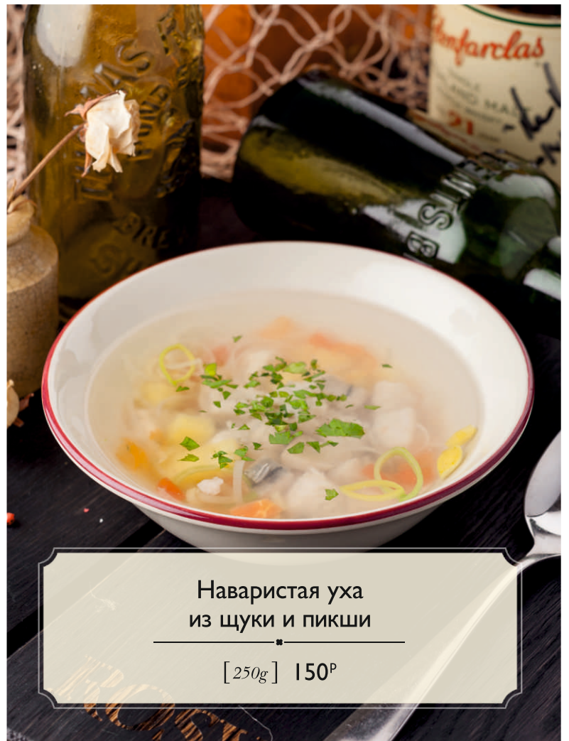
Наваристая уха из щуки и пикши