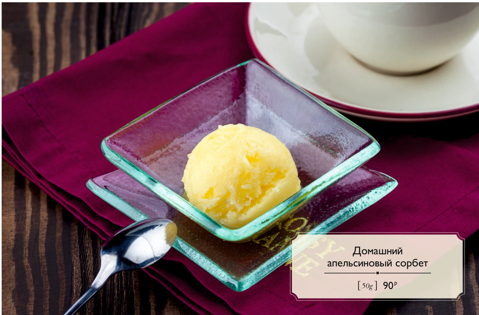
Домашний апельсиновый сорбет