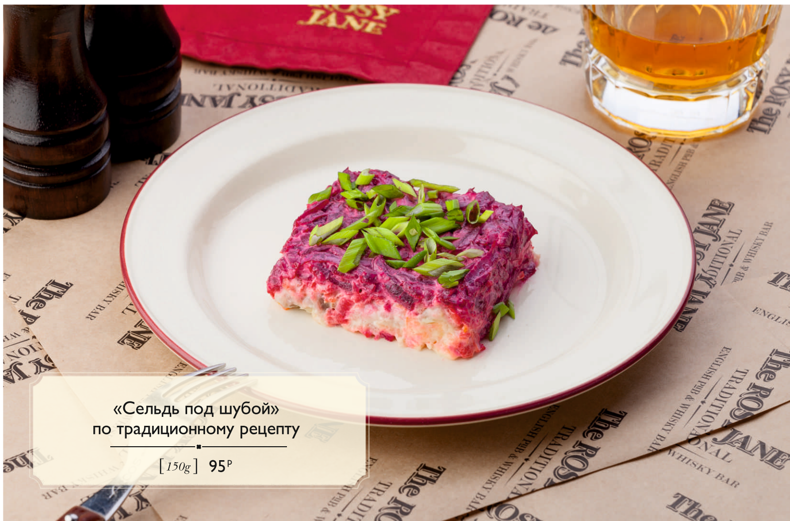
«Сельдь под шубой» по традиционному рецепту