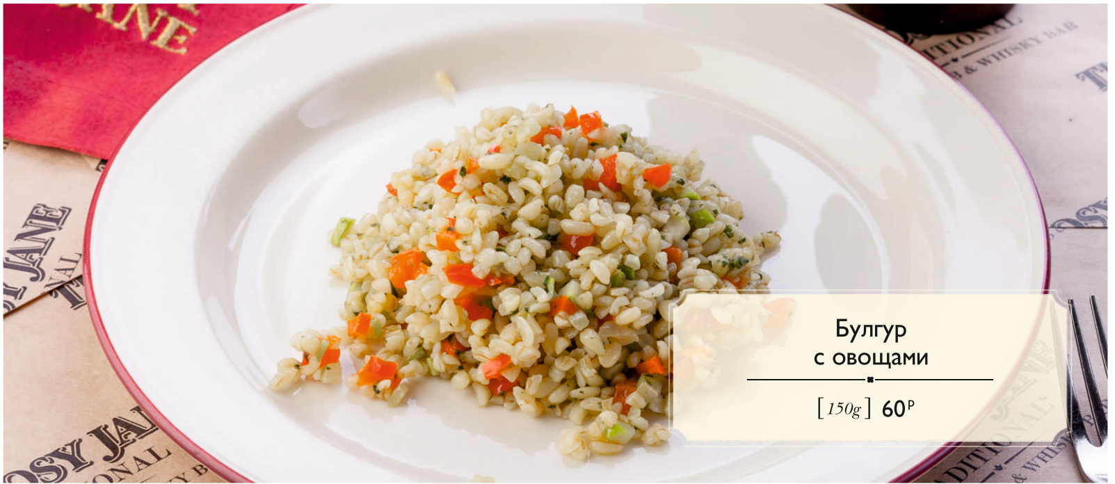
Булгур с овощами