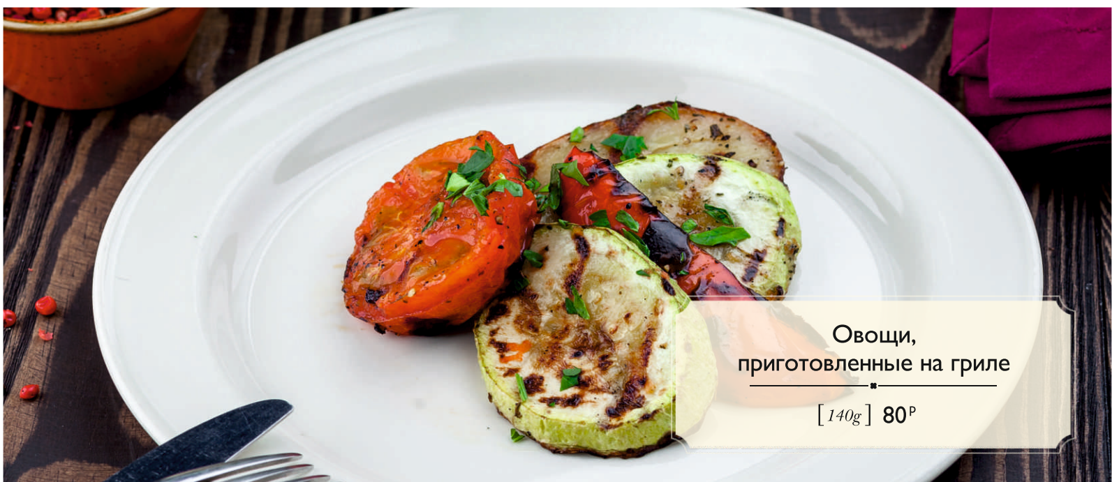
Овощи, приготовленные на гриле