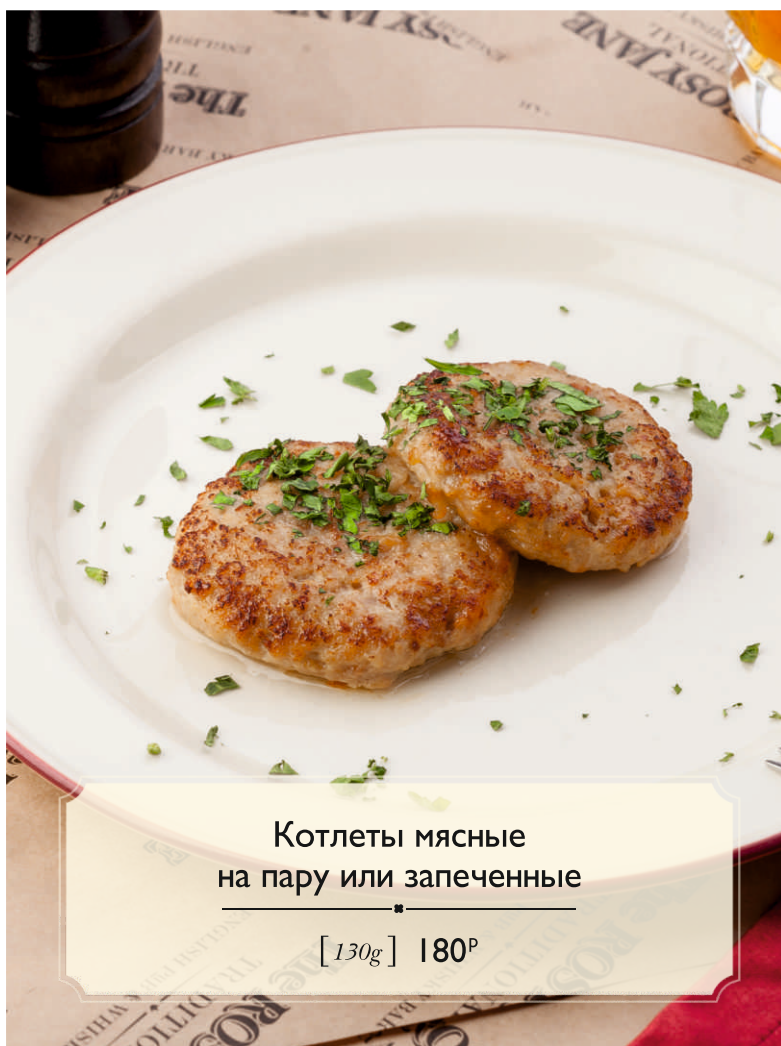
Котлеты мясные на пару или запеченные