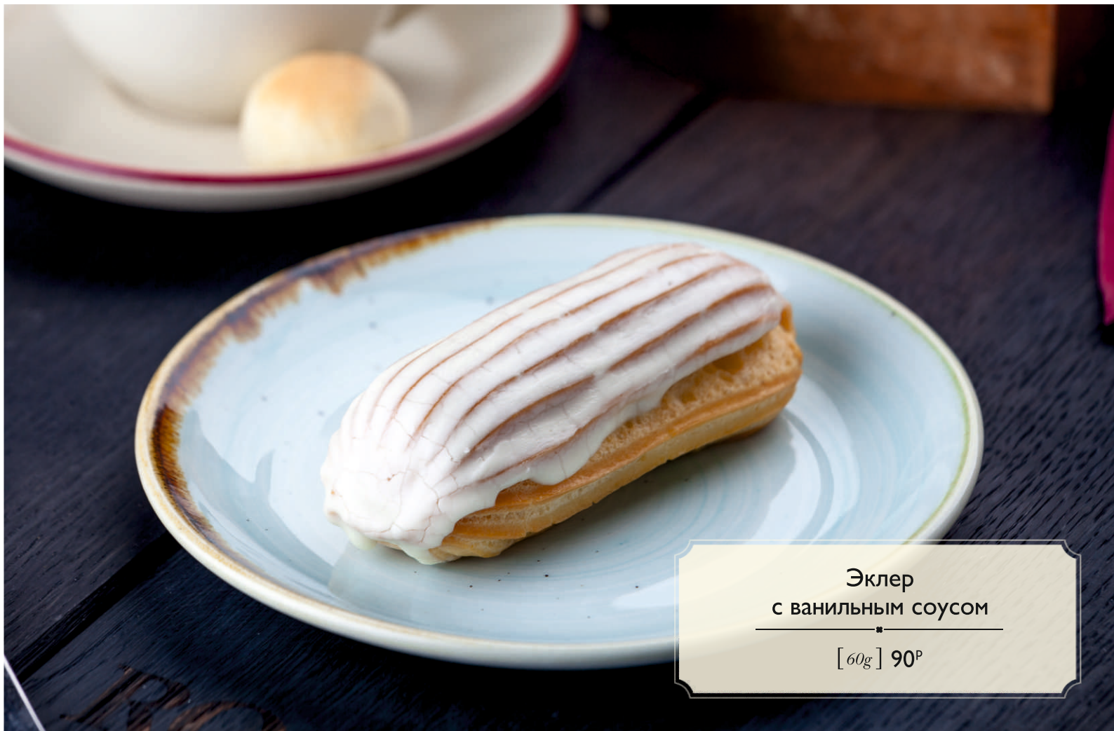
Эклер с ванильным соусом