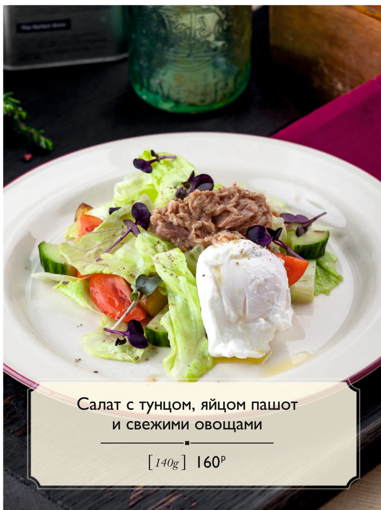
Салат с тунцом, яйцом пашот и свежими овощами