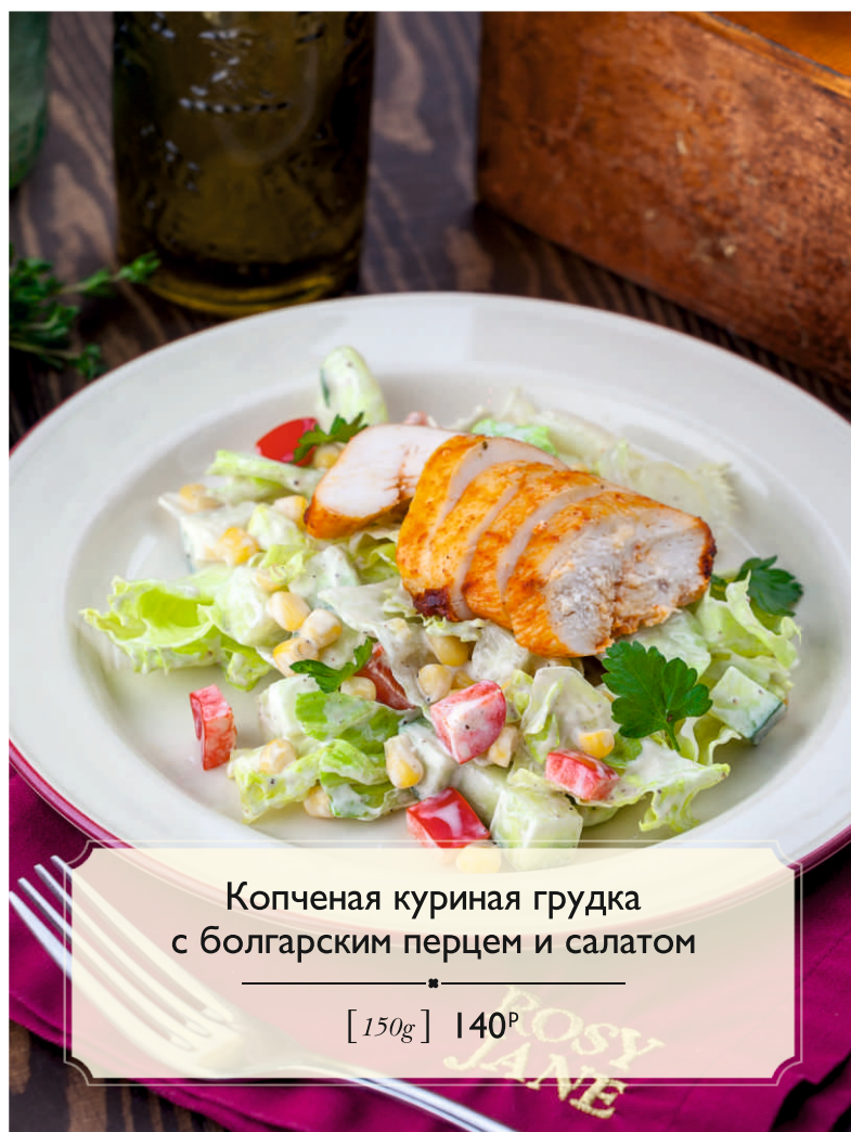
Копченая куриная грудка с болгарским перцем и салатом