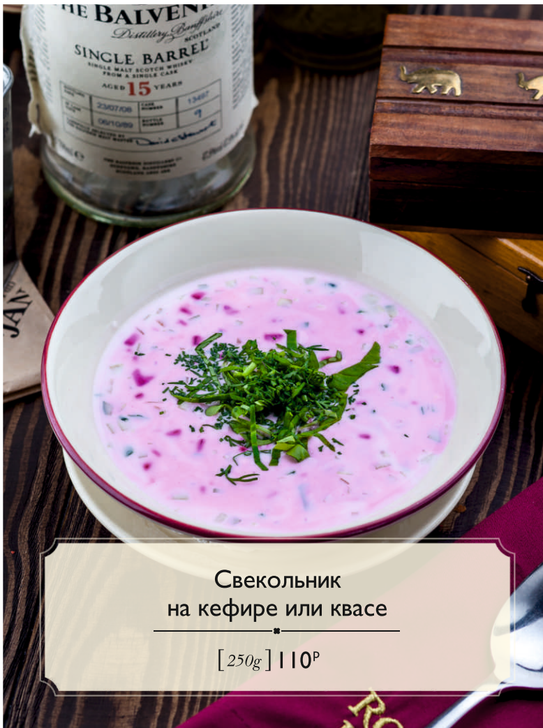
Свекольник на кефире или квасе