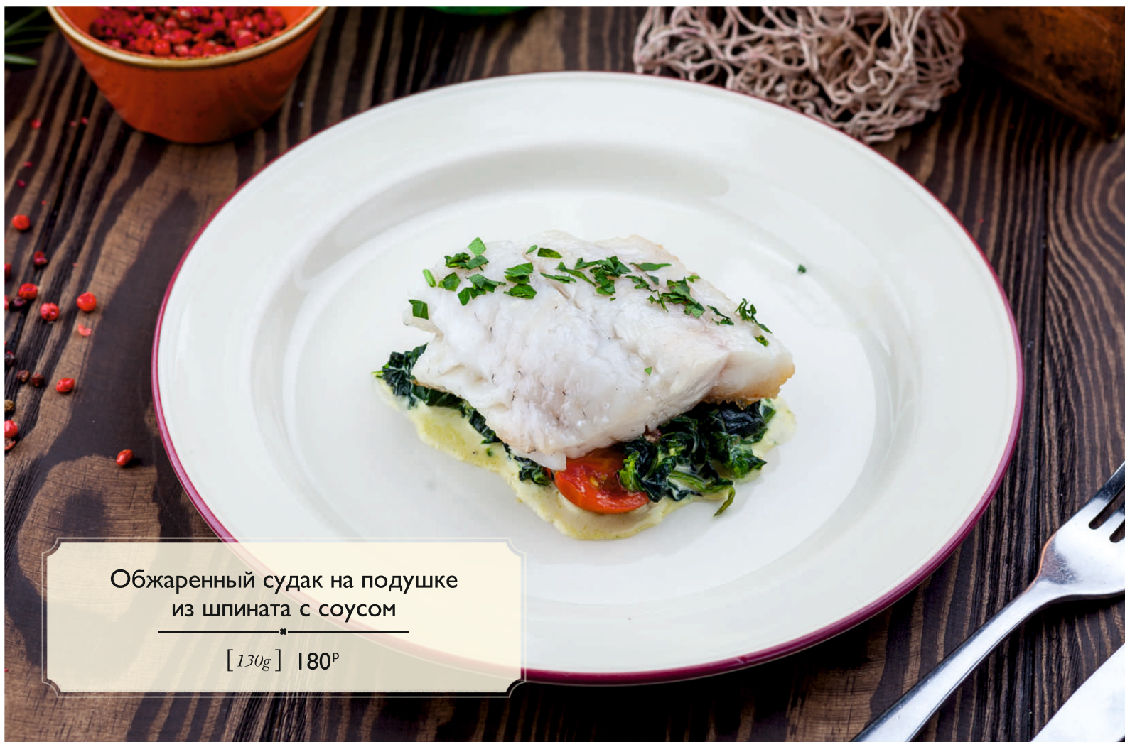
Обжаренный судак на подушке из шпината с соусом