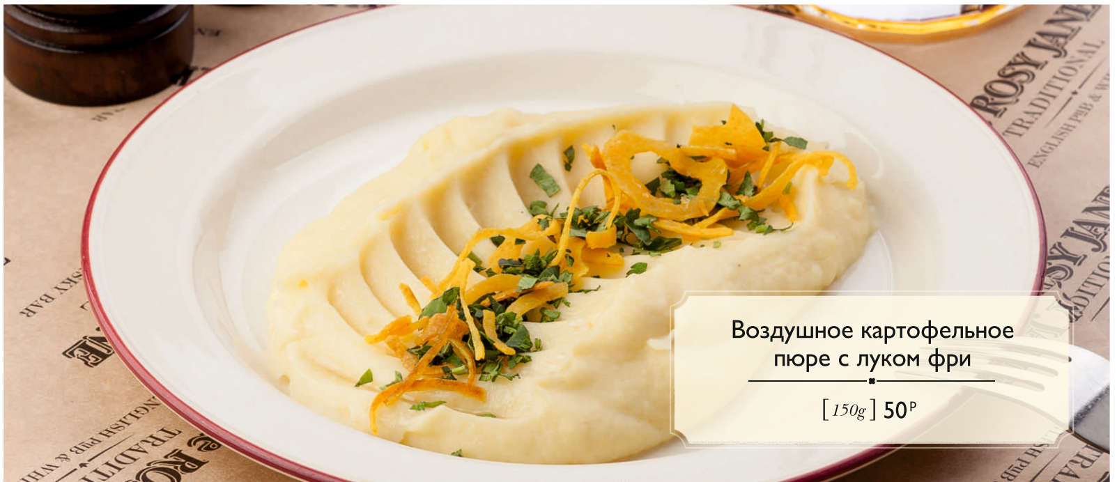
Воздушное картофельное пюре с луком фри