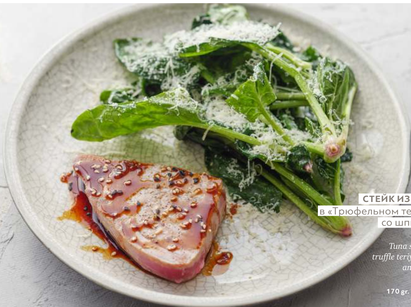
СТЕЙК ИЗ ТУНЦА в «Трюфельном терияки» со шпинатом

Tuna steak with truffle teriyaki sauce and spinach