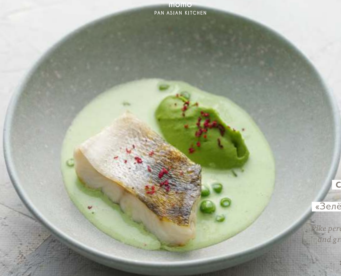
СУДАК С БРОККОЛИ и соусом «Зелёный карри»

Pike perch with broccoli and green curry sauce