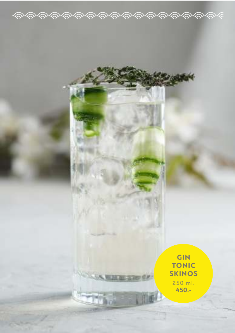
GIN TONIC SKINOS 250 ml. 450.-