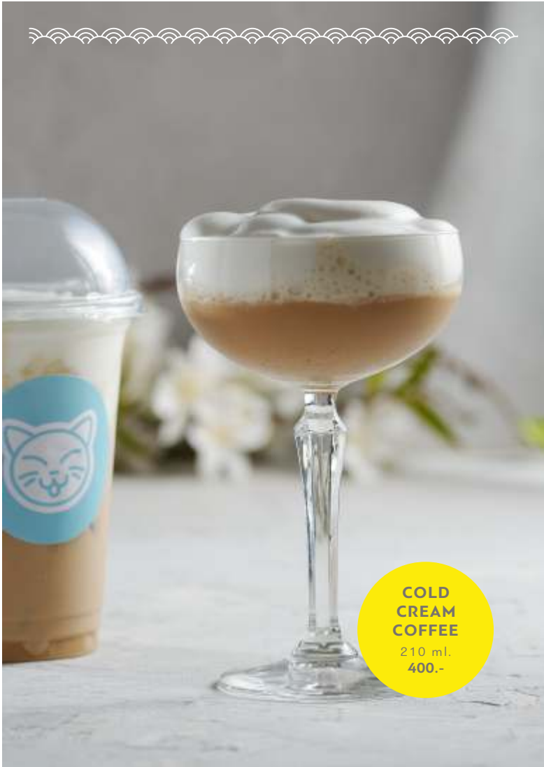
COLD CREAM COFFEE 210 ml. 400.-