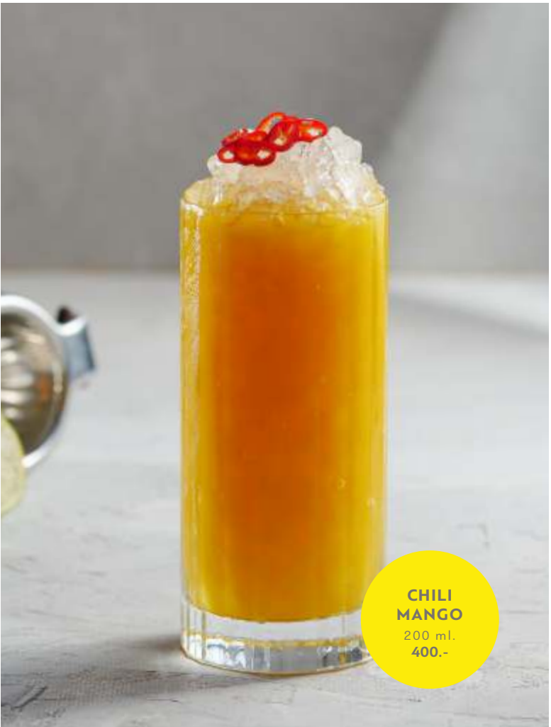
CHILI MANGO 200 ml. 400.-