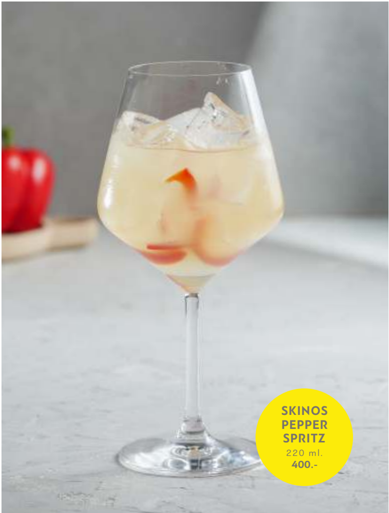
SKINOS PEPPER SPRITZ 220 ml. 400.-