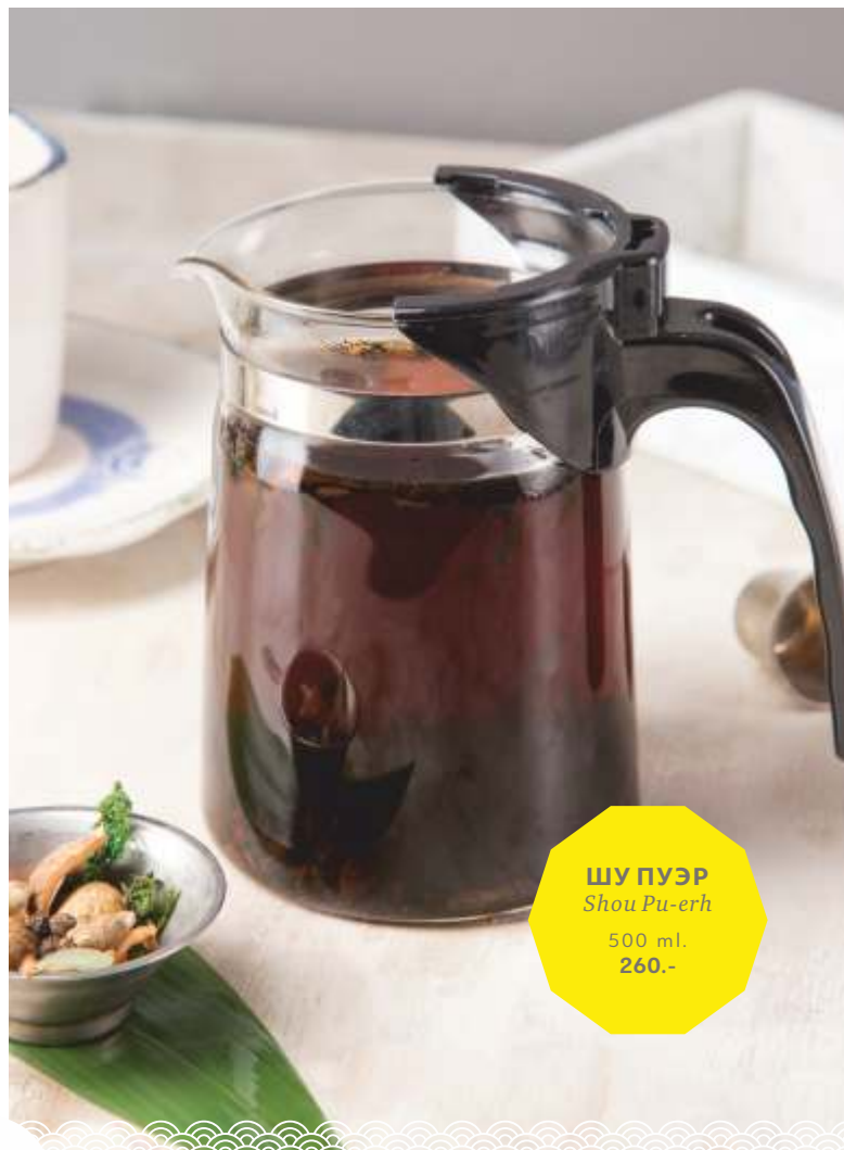
ШУ ПУЭР Shou Pu-erh 500 ml. 260.-