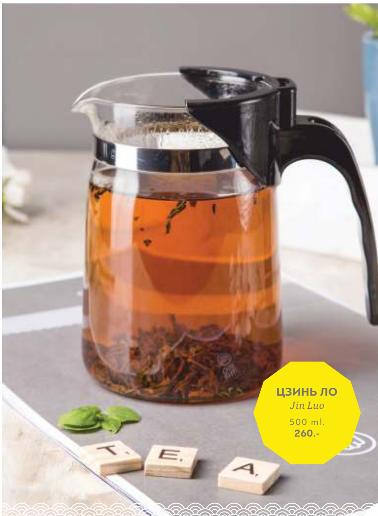
ЦЗИНЬ ЛО Jin Luo 500 ml. 260.-