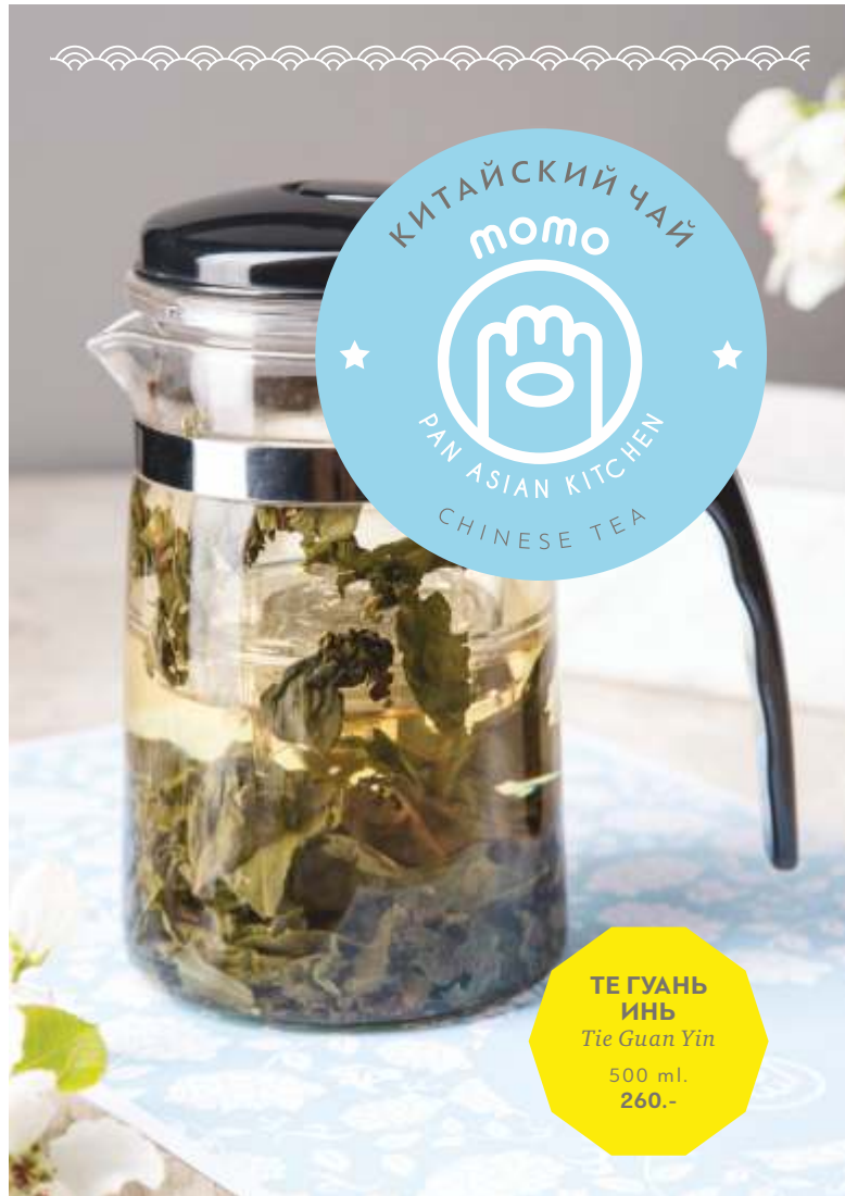
ТЕ ГУАНЬ ИНЬ Tie Guan Yin 500 ml. 260.-