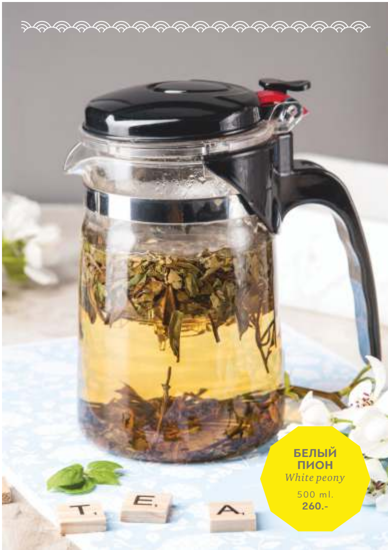
БЕЛЫЙ ПИОН White peony 500 ml. 260.-