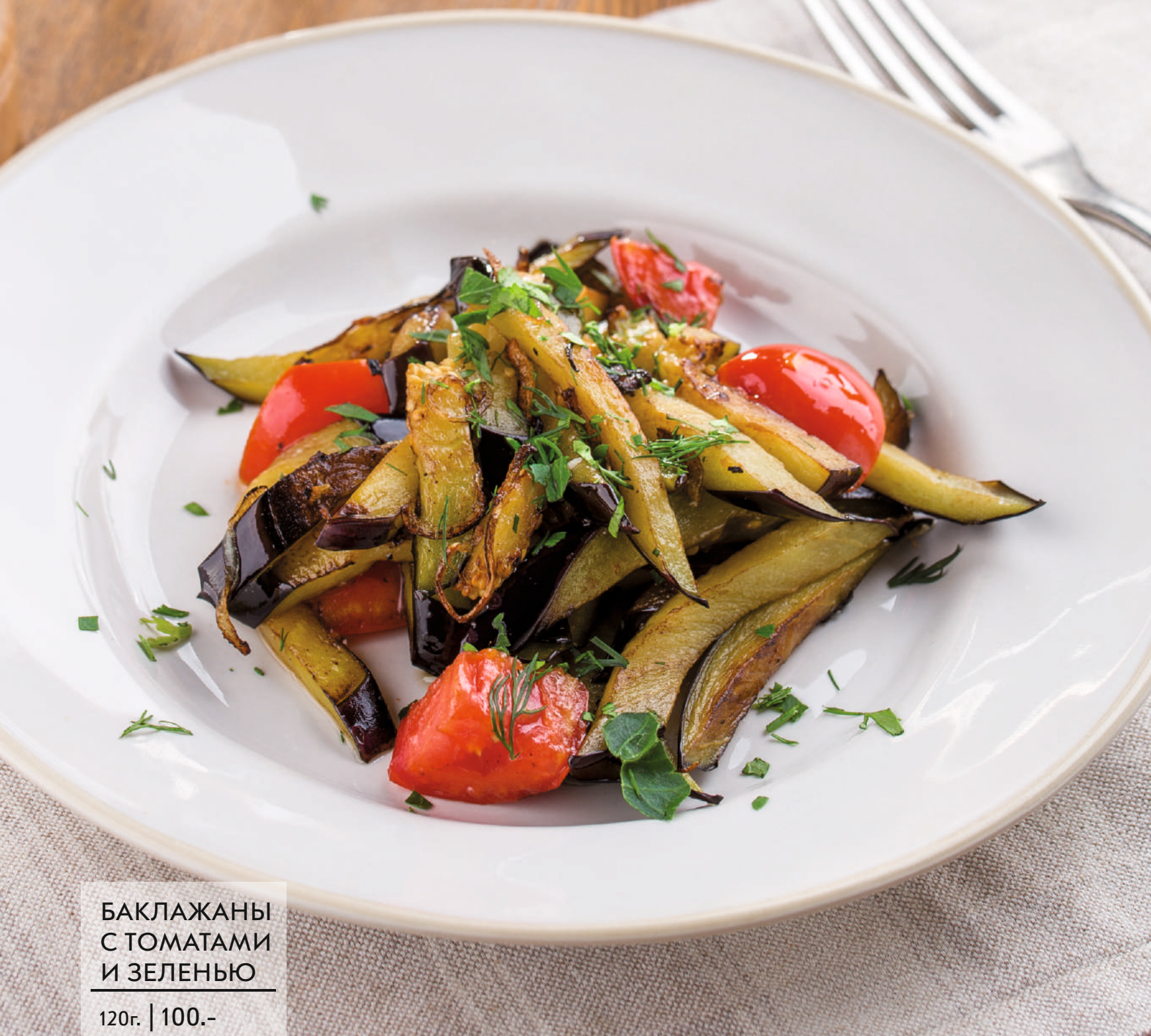
БАКЛАЖАНЫ С ТОМАТАМИ И ЗЕЛЕНЬЮ 120г. | 100.-