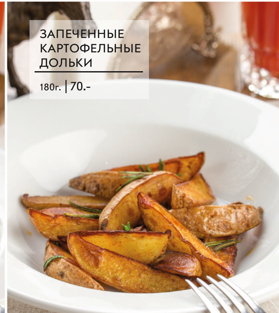
ЗАПЕЧЕННЫЕ КАРТОФЕЛЬНЫЕ ДОЛЬКИ 180г. | 70.-