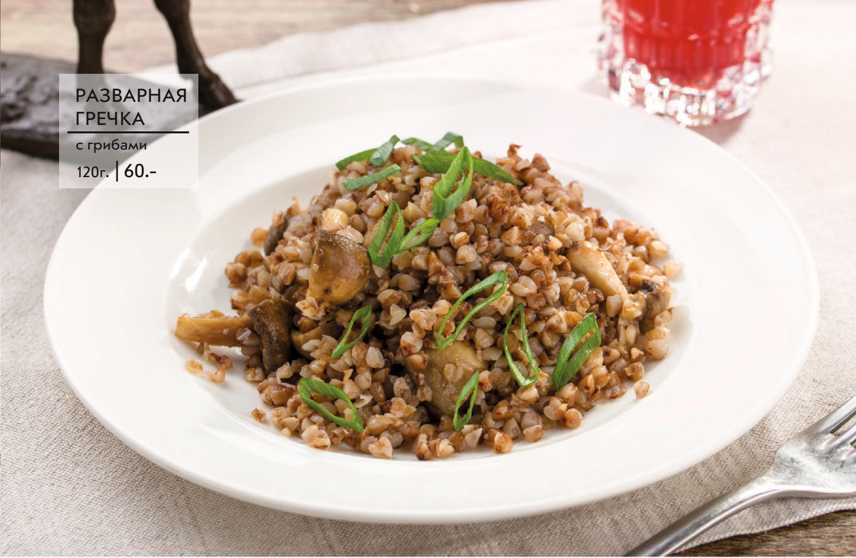
РАЗВАРНАЯ ГРЕЧКА с грибами 120г. | 60.-