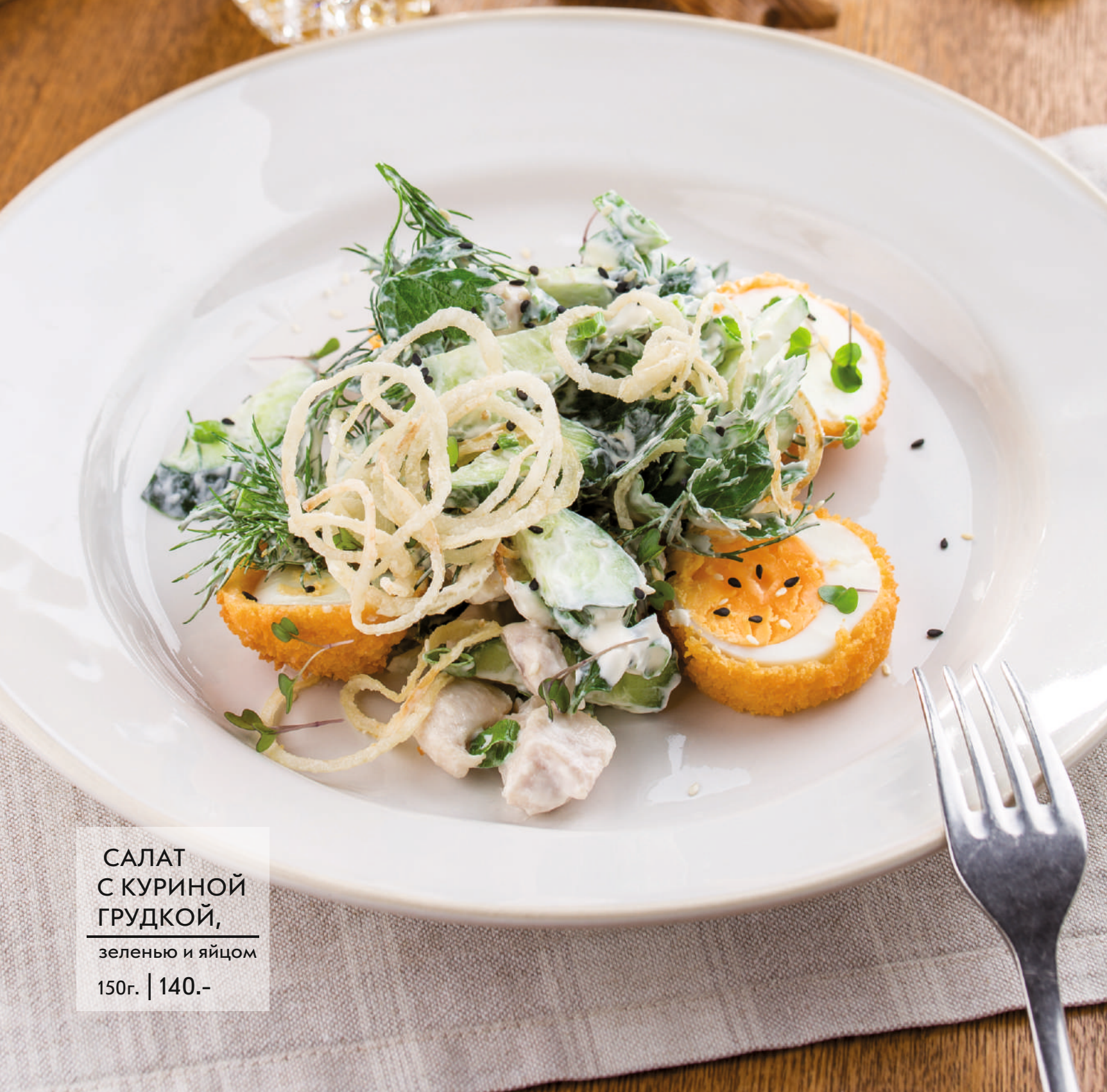
САЛАТ С КУРИНОЙ ГРУДКОЙ, зеленью и яйцом 150г. | 140.-