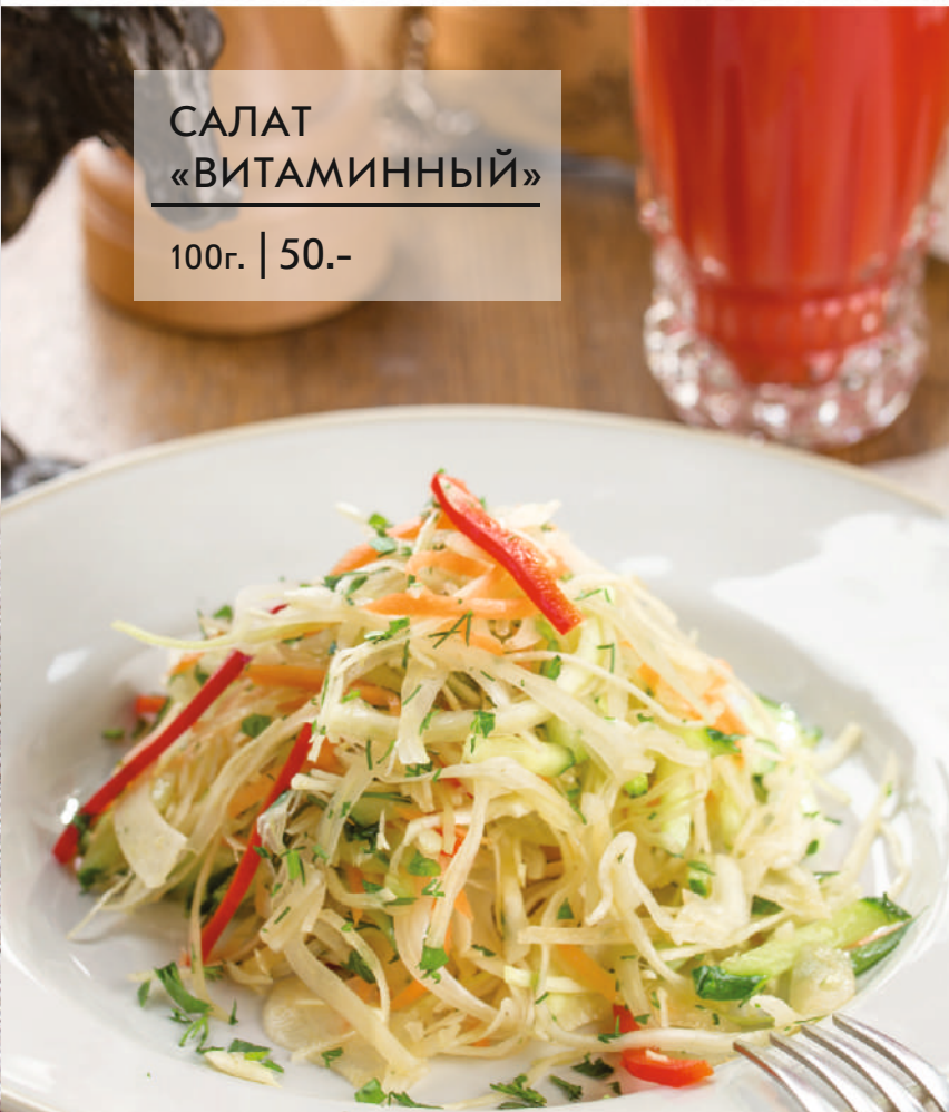
САЛАТ «ВИТАМИННЫЙ» 100г. | 50.-