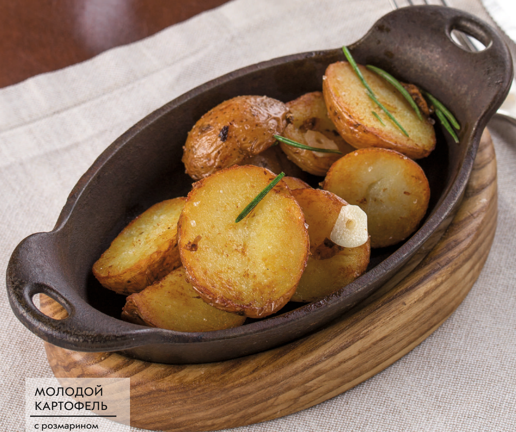
МОЛОДОЙ КАРТОФЕЛЬ с розмарином 150г. | 60.-