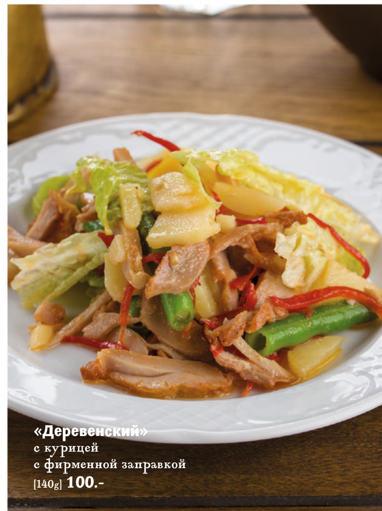
«Деревенский» с курицей с фирменной заправкой [140g] 100.-