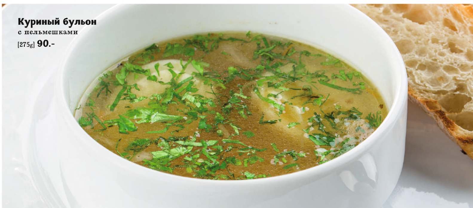
Куриный бульон с пельмешками [275g] 90.-