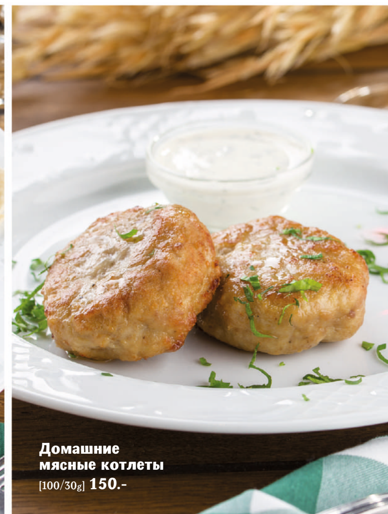
Домашние мясные котлеты [100/30g] 150.-