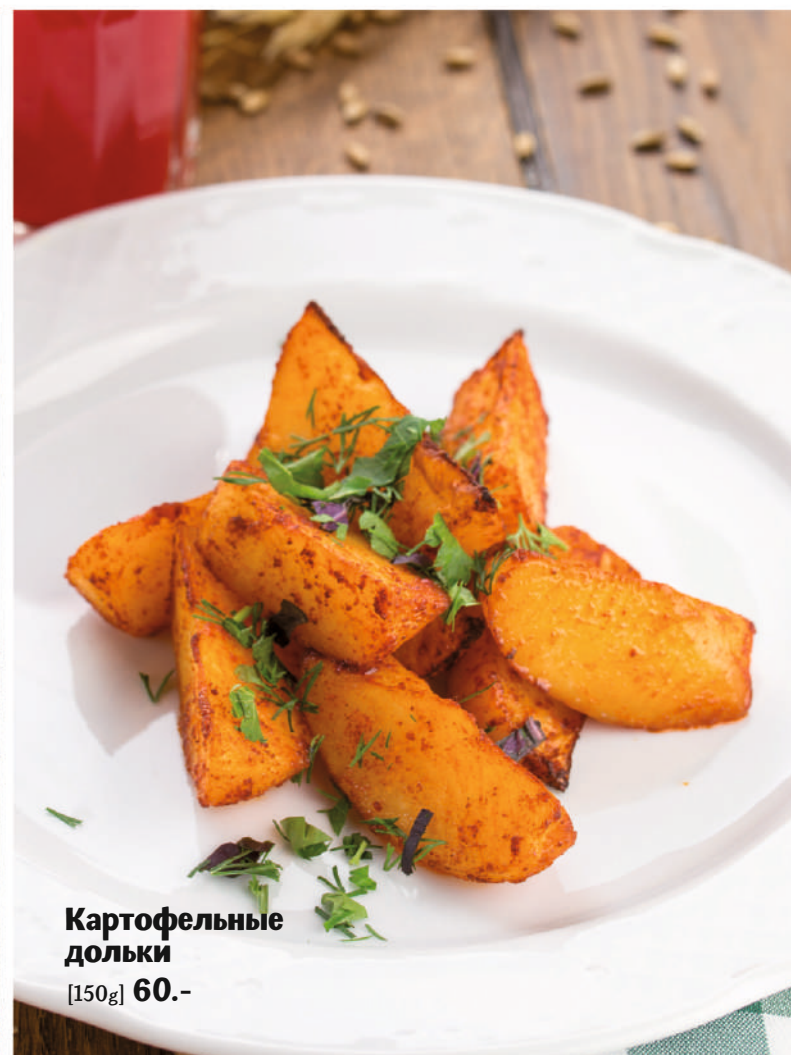
Картофельные дольки [150g] 60.-