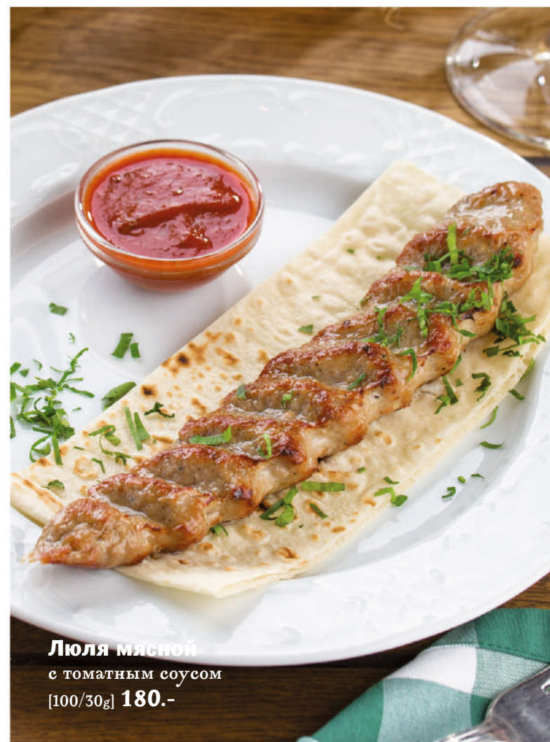
Люля мясной с томатным соусом [100/30g] 180.-