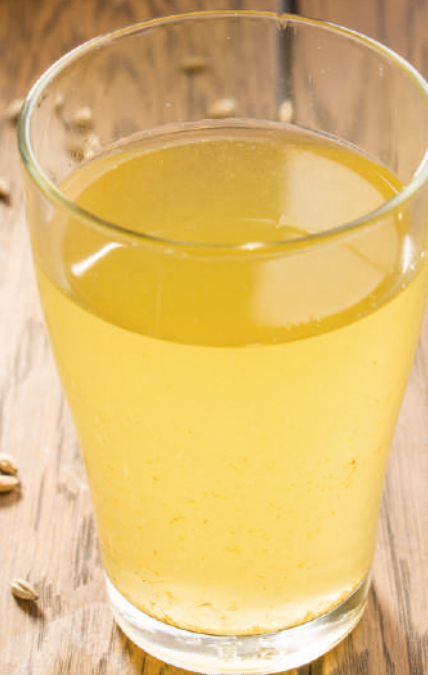
Компот курага [250ml] 60.-