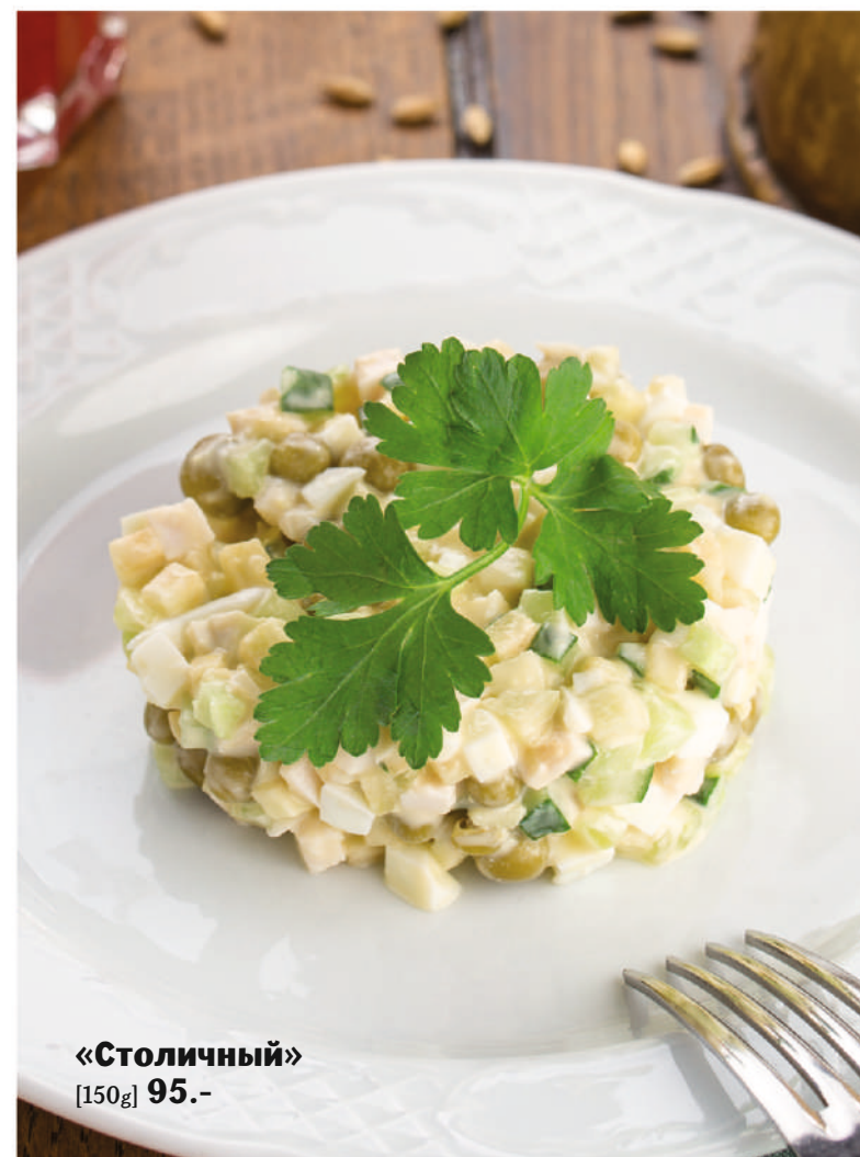
«Столичный» [150g] 95.-