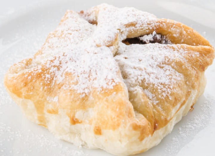
Слоеный пирожок с сухофруктами [60g] 70.-