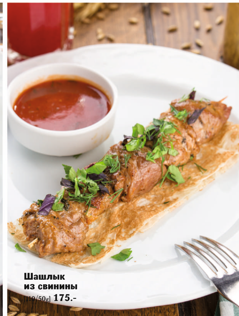
Шашлык из свинины [100/50g] 175.-