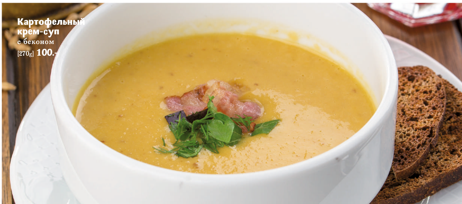
Картофельный крем-суп с беконом [270g] 100.-