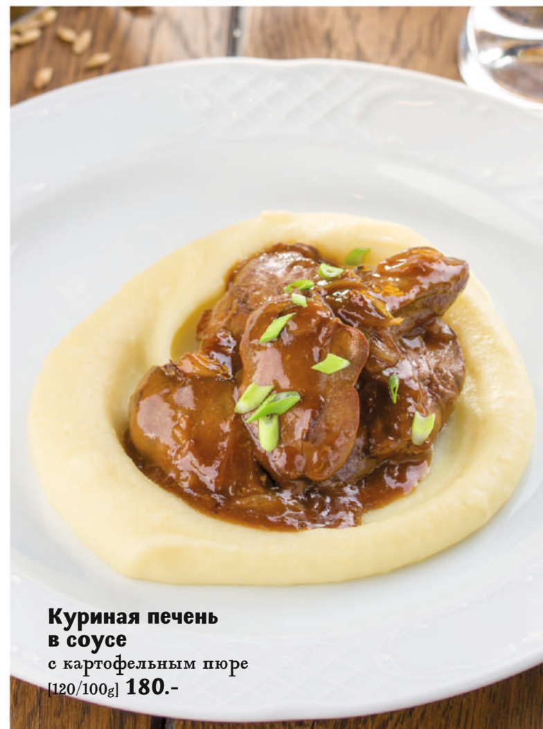
Куриная печень в соусе с картофельным пюре [120/100g] 180.-