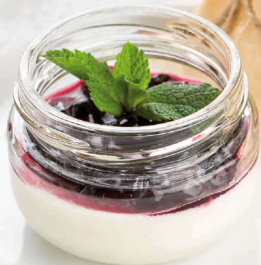
Черника-панакотта [60g] 70.-