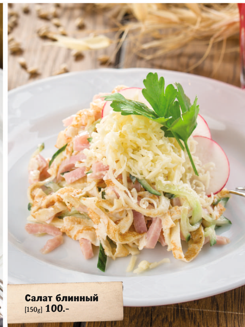
Салат блинный [150g] 100.-