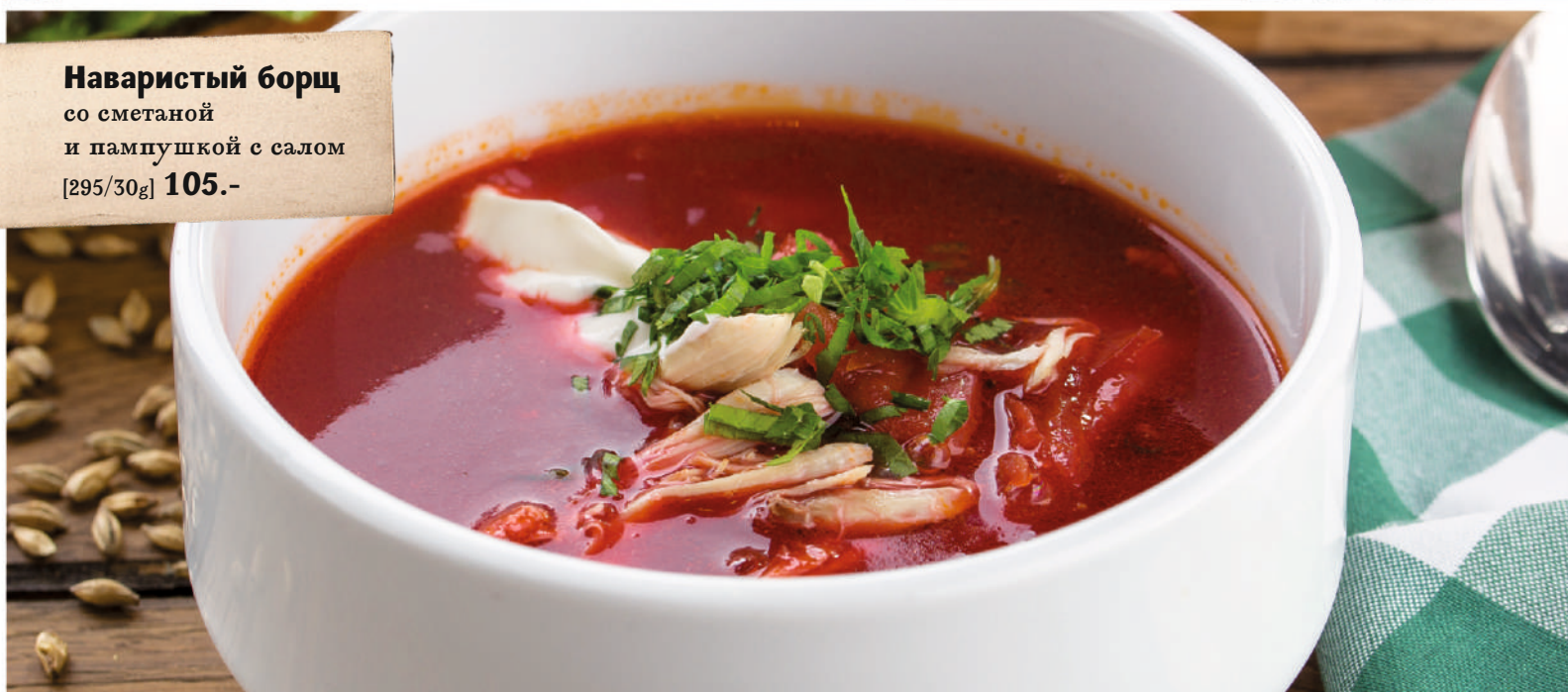
Наваристый борщ со сметаной и пампушкой с салом [295/30g] 105.-