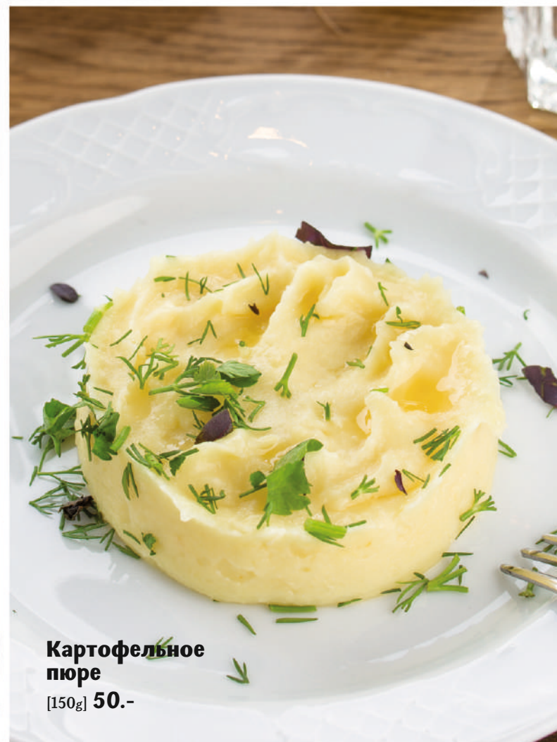
Картофельное пюре [150g] 50.-