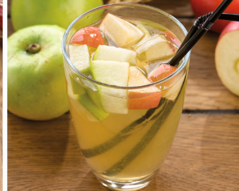
Яблочный лимонд [280ml] 110.-