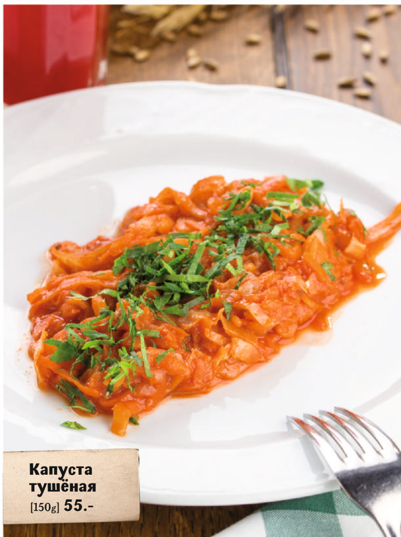
Капуста тушёная [150g] 55.-