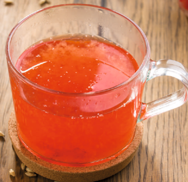
Чай «Красная смородина» [300ml] 90.-