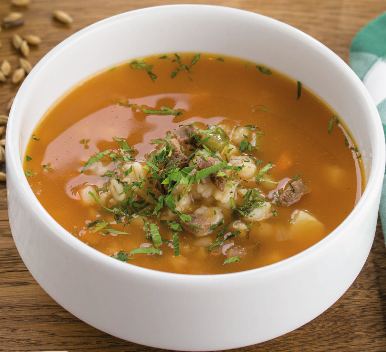
Рассольник с мясом [280g] 100.-