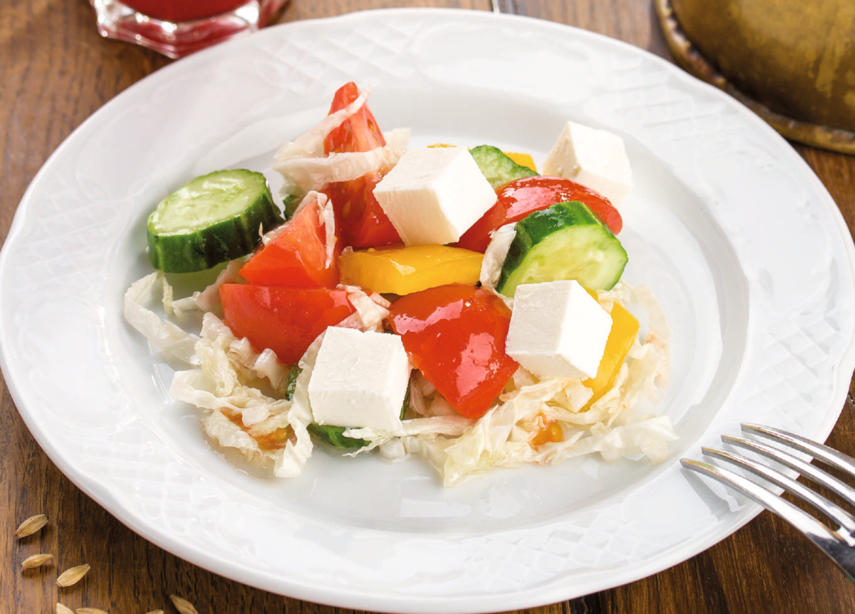
Салат овощной с домашним сыром [150g] 95.-