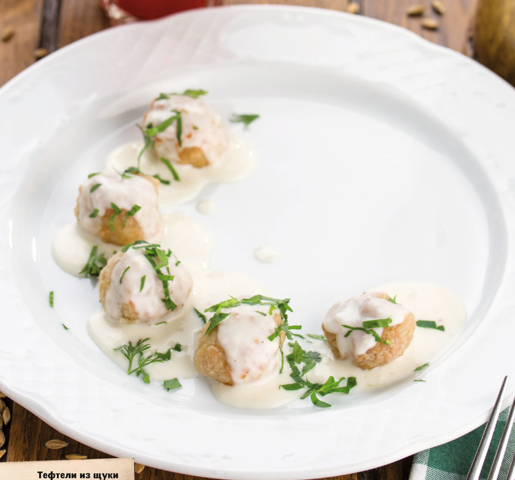
Тeftели из щуки в сливочном соусе [100/30g] 170.-