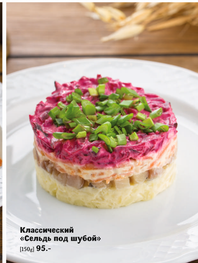
Классический «Сельдь под шубой» [150g] 95.-