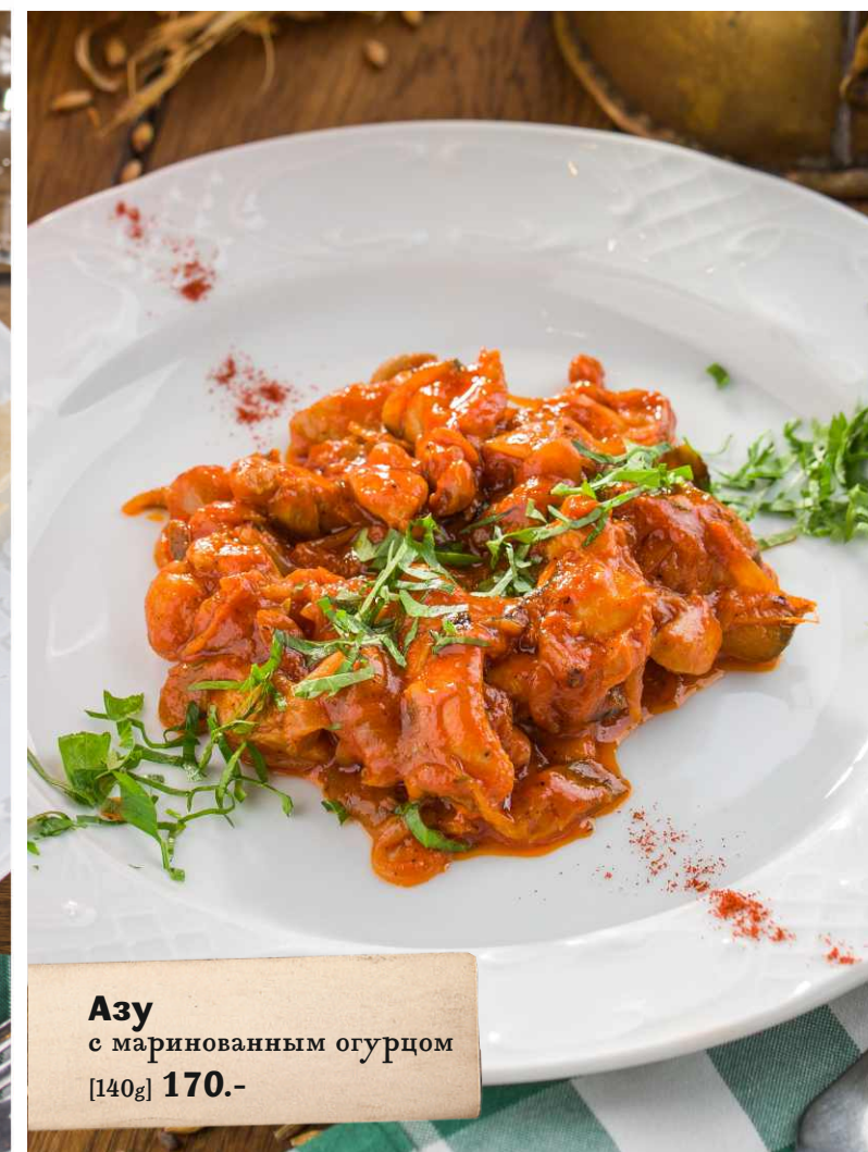
Азу с маринованным огурцом [140g] 170.-