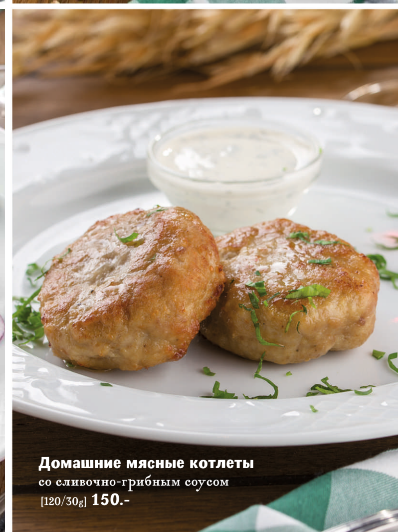
Домашние мясные котлеты со сливочно-грибным соусом [120/30g] 150.-