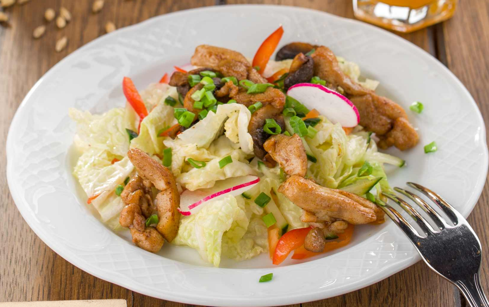
Салат с жареной курицей и шампиньонами