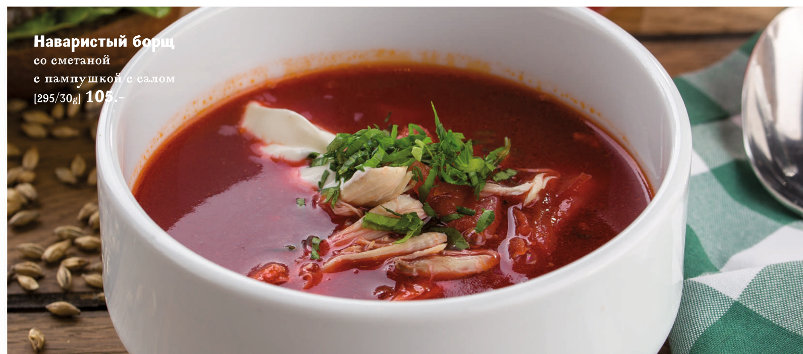
Наваристый борщ со сметаной с пампушкой с салом [295/30g] 105.-