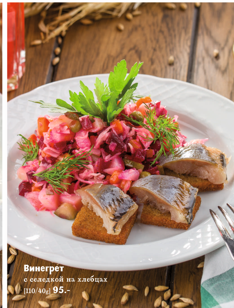
Винегрет с селедкой на хлебцах