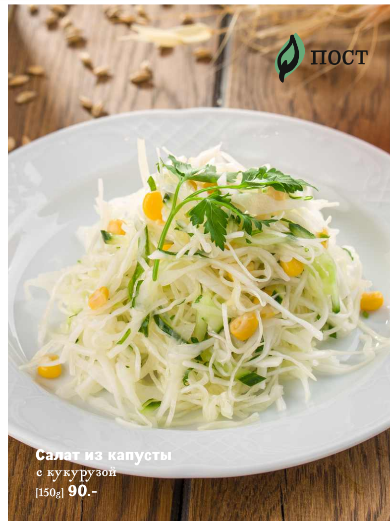
Салат из капусты с кукурузой