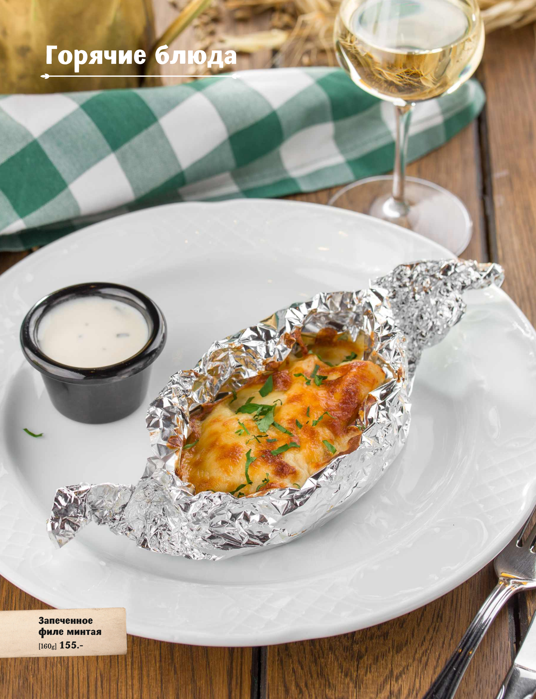
Запеченное филе минтая [160g] 155.-