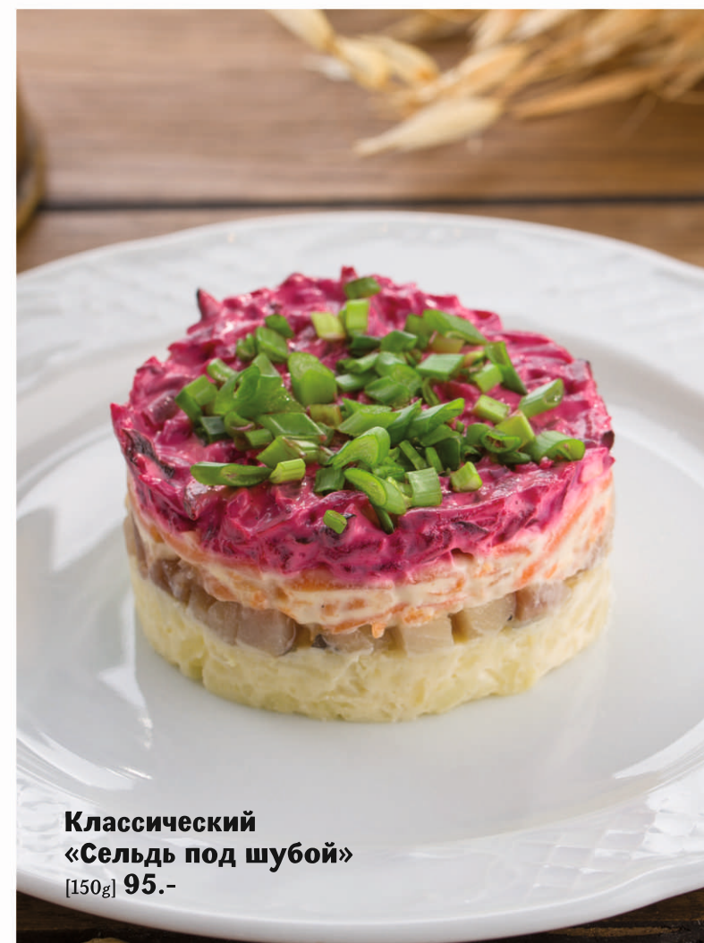
Классический «Сельдь под шубой»