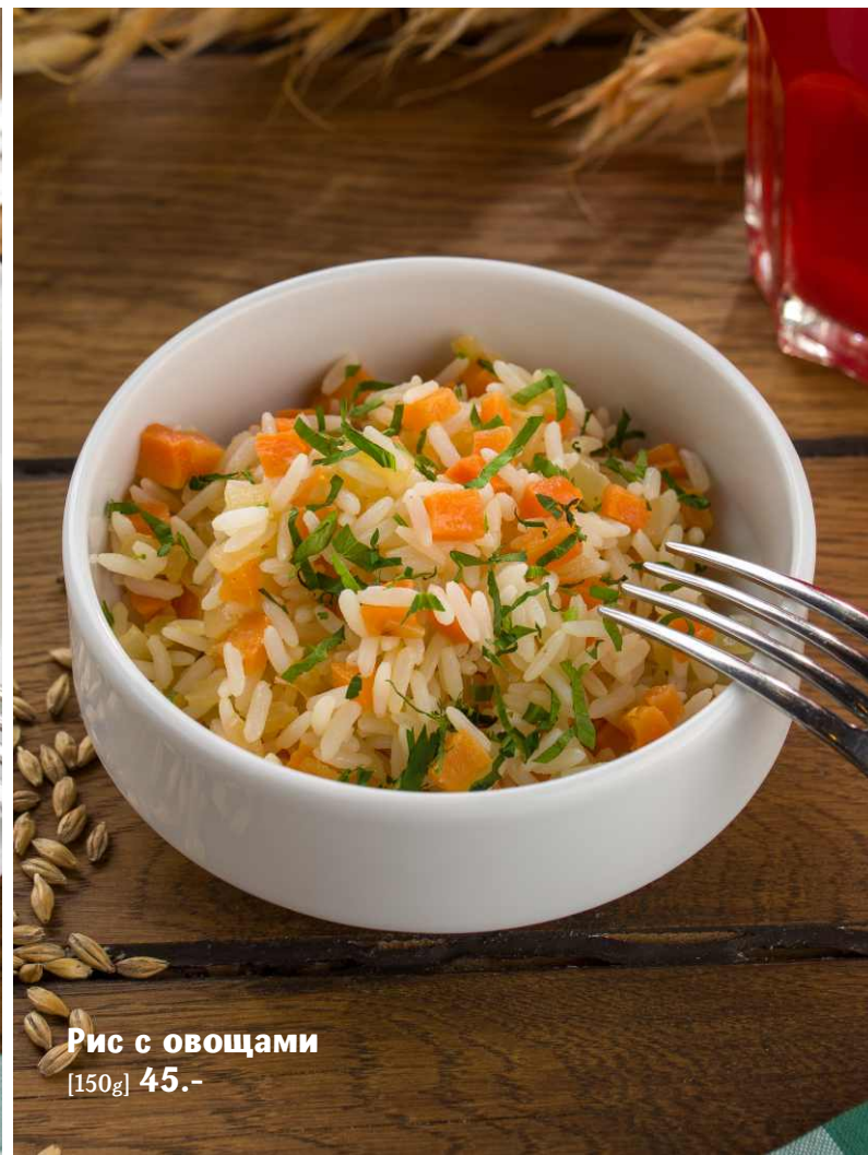
Рис с овощами [150g] 45.-