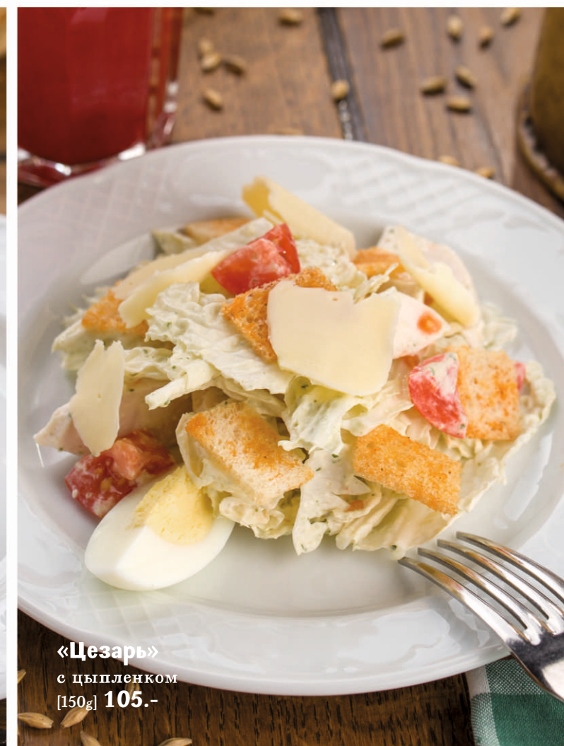
«Цезарь» с цыпленком