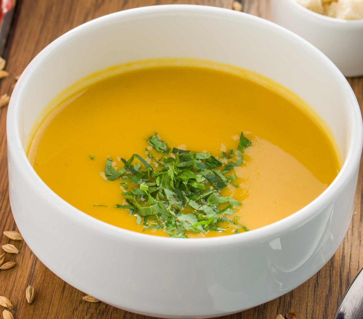
Крем-суп из тыквы с гренками [230/10g] 95.-