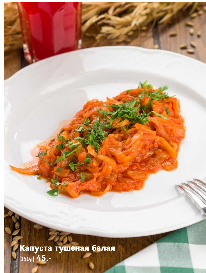
Капуста тушеная белая [150g] 45.-