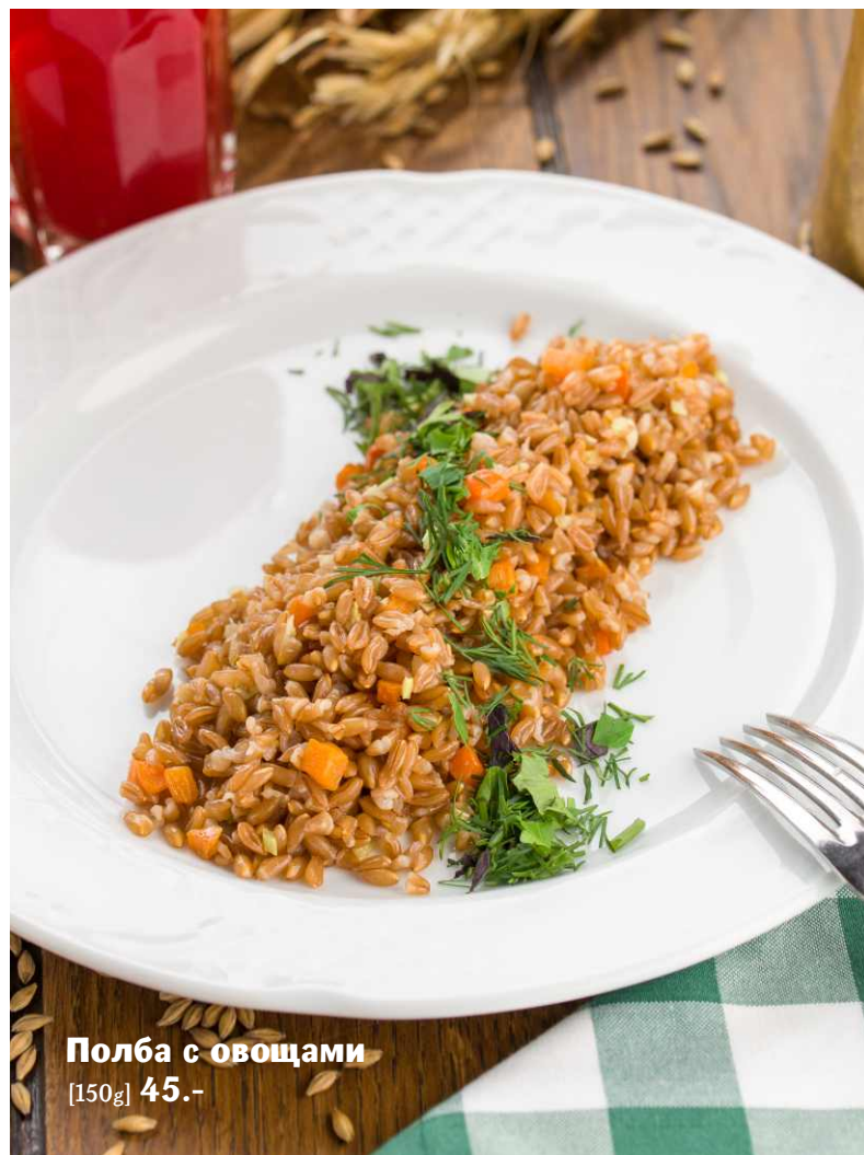
Полба с овощами [150g] 45.-