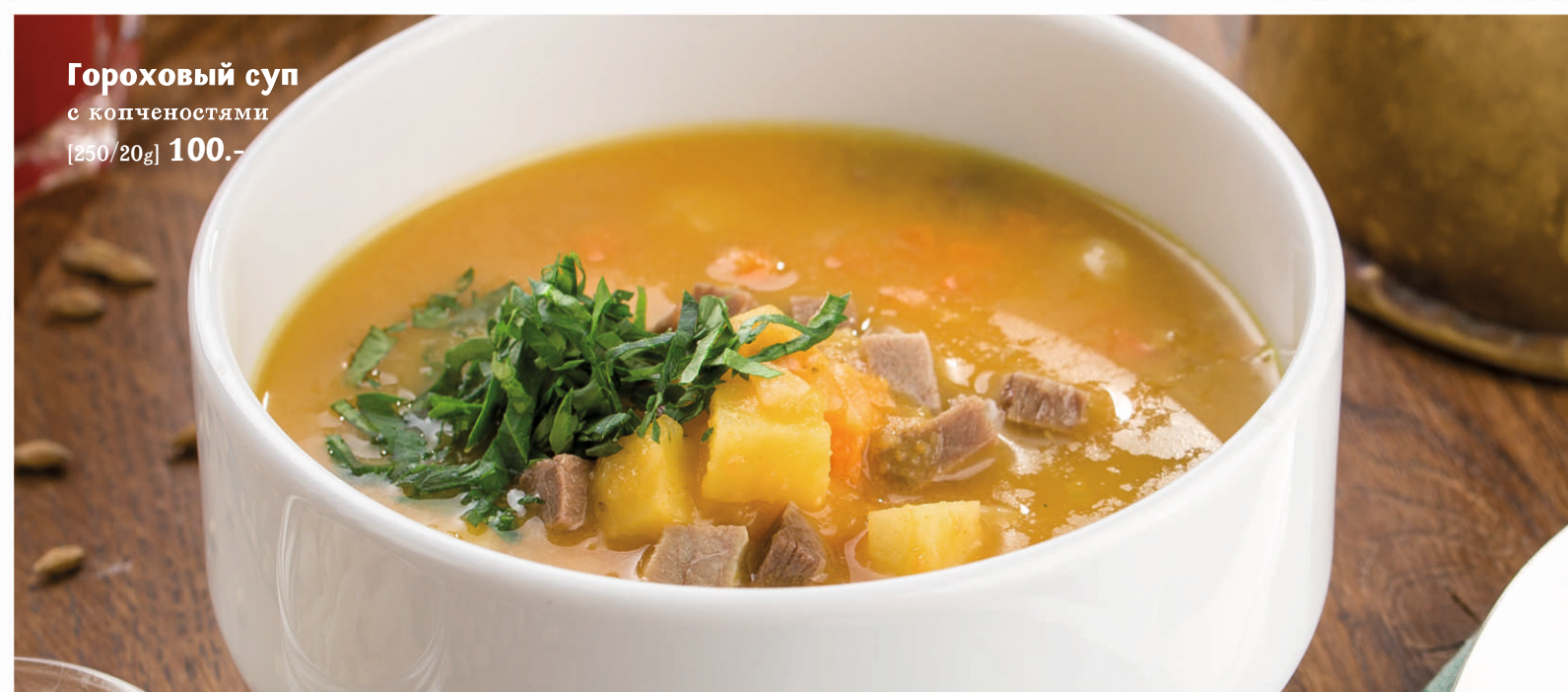
Гороховый суп с копченостями [250/20g] 100.-