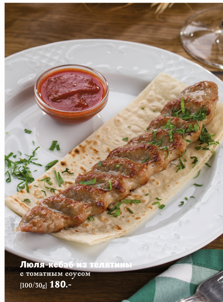
Люля-кебаб из телятины с томатным соусом [100/30g] 180.-