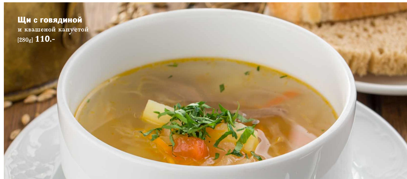
Щи с говядиной и квашеной капустой [280g] 110.-