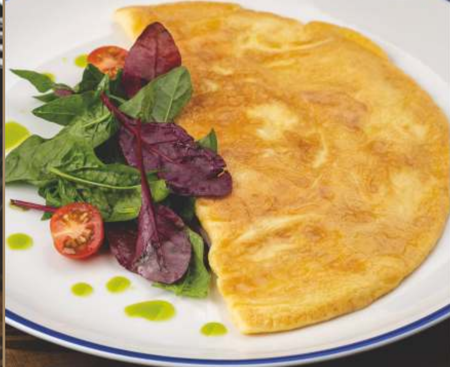
ОМЛЕТ ИЗ ТРЕХ ЯИЦ Three egg omelet