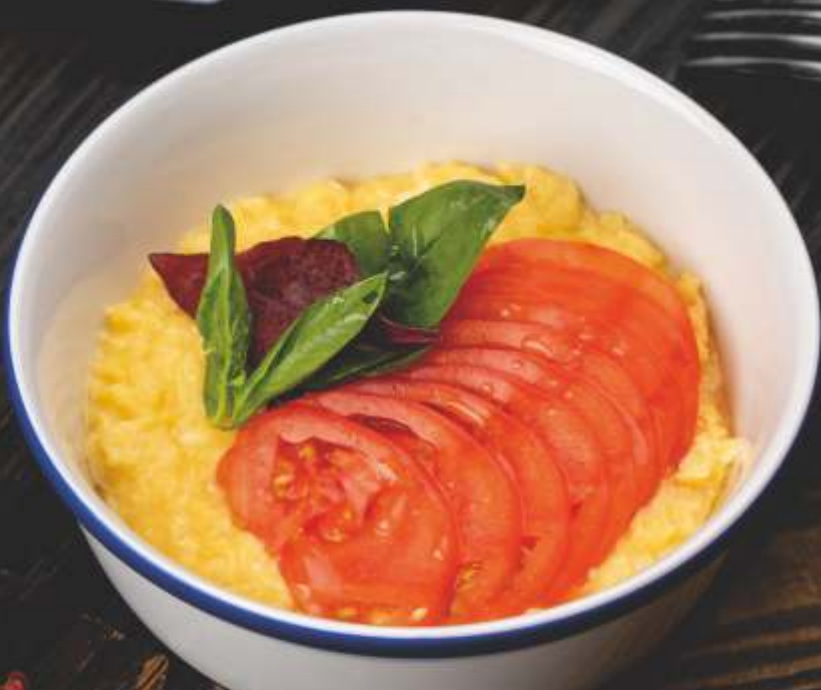
СКРЭМБЛ со спелыми помидорами Scrambled eggs with ripe tomatoes