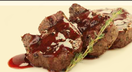
Медальоны из телятины в вишневом соусе 140/20г ~ 380 Р