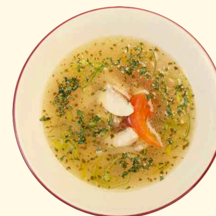
Белорыбная уха 250г ~ 140 Р