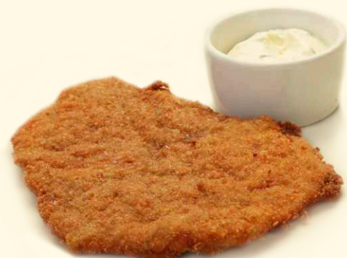
Шницель «Венский» 100/30г ~ 170 Р