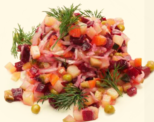
Винегрет овощной 150г ~ 80 Р