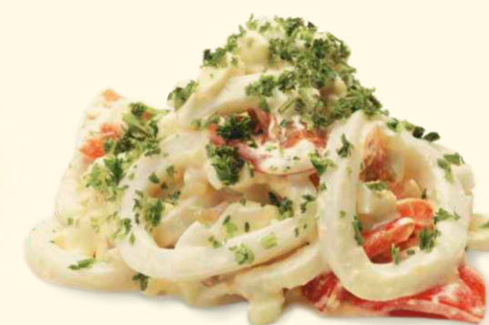
Салат с кальмарами и снежным крабом 140г ~ 140 Р