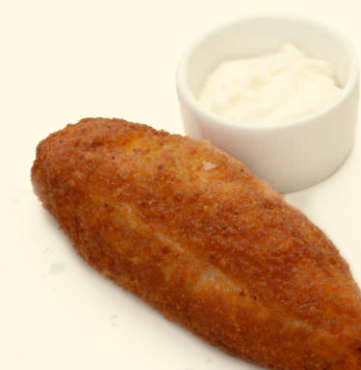
Котлета пышная с соусом «Ранч» 120/30г ~ 200 Р