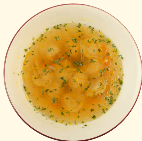
Бульон куриный с пельменями 250г ~ 130 Р