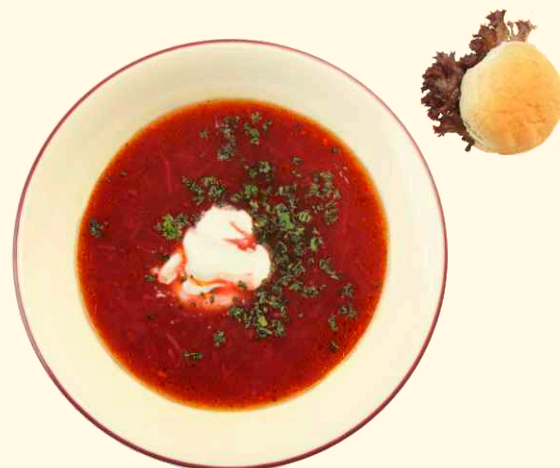
Борщ с чесночной булочкой 230/50/30г ~ 140 Р