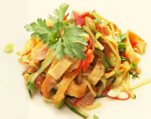
Салат с курицей и омлетом 150г ~ 120 Р