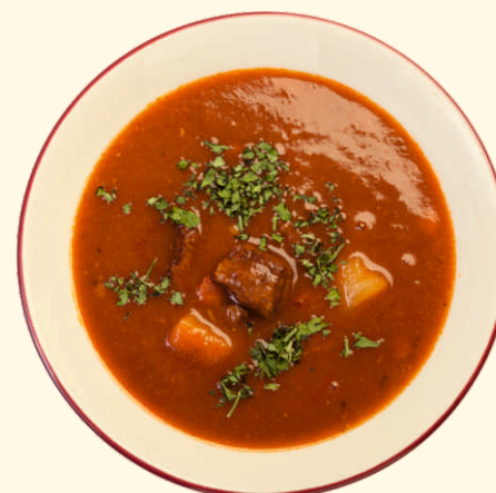
Суп-гуляш с фасолью 250г ~ 150 Р