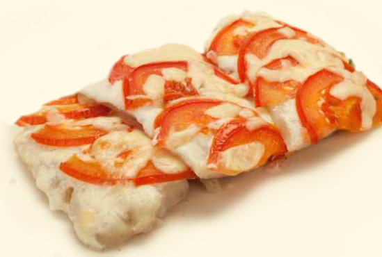
Филе минтая под сметаной 130г ~ 170 Р