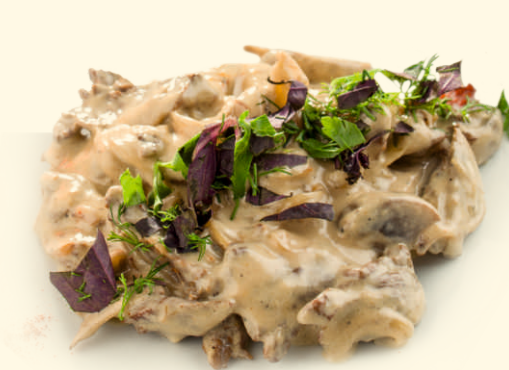
Бефстроганов 150г ~ 220 Р