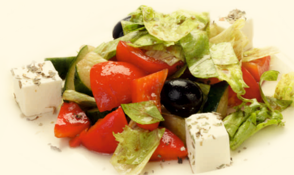
Салат «Греческий» 140г ~ 140 Р