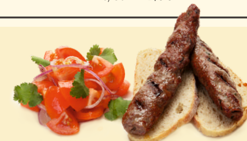
Два люля-кебаба из баранины с салатом из помидоров 100/100/30г ~ 250 Р