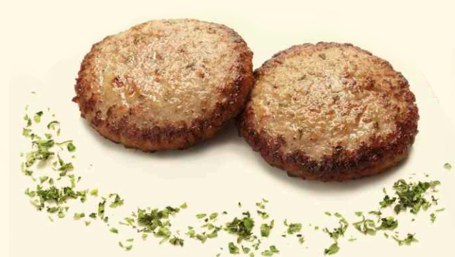
Котлетки мясные на пару или запеченные 130г ~ 180 Р