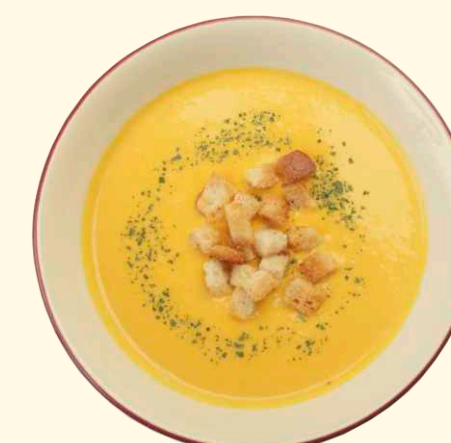
Суп-пюре из тыквы 250/10г ~ 140 Р